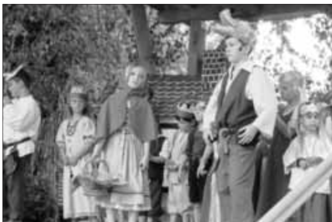
Kinderchor Singspiel „Rotkäppchen“ auf dem Stadtfest Juli 2015