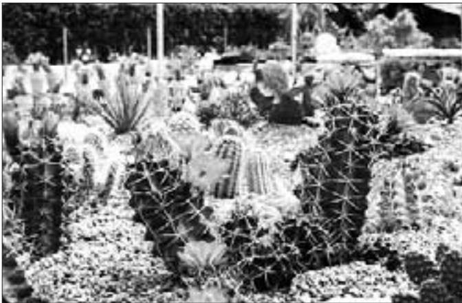
Kakteengarten Oettingen Juni 2006