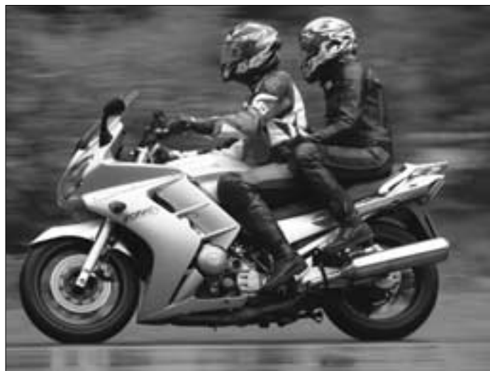
Da kommt richtig Freude auf: Mit dem Partner auf dem Motorrad die Gegend erkunden.

Eine ganz andere Zielgruppe haben die „Snake“ und „Blaster“ Modelle. Kleines Scheinwerferauge, besonders dicke Reifen im Format 120/70-12 vorn bzw. 130/70-12 hinten und tolle Lackierungen (z.B. „Adrenalin Orange“) verleihen dem Ludix 2 Snake (1.589 Euro) und dem Ludix 2 Snake Furious (1.649 Euro) einen bulligen Streetfighter-Auftritt. Die Topmodelle: Ludix 2 Blaster R-Cup (1.799 Euro) und RS 12 (1.849 Euro). Als reinrassige Renn-Scooter bieten sie nicht nur die sportlich gezackte Shurricane-Bremsscheibe vorn, sondern markante Wasserkühler beidseitig der Verkleidungsfront mit einer Leistungsausbeute von satten 4,9 PS. Mangelndes Temperament lässt sich freilich auch den anderen Ludix-Modellen nicht vorwerfen: Mit seiner schlanken Linie bringt der Ludix 2 in Basisversion nur 66 kg auf die Waage – und flitzt den meisten anderen 50 ccm-Rollern schon deshalb bei Ampelstarts auf und davon.