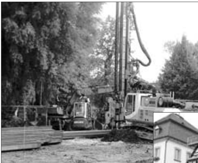
Regenrückhaltebecken an der Stadthalle