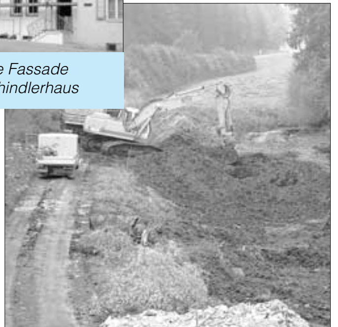
Weiherräumung in Warching