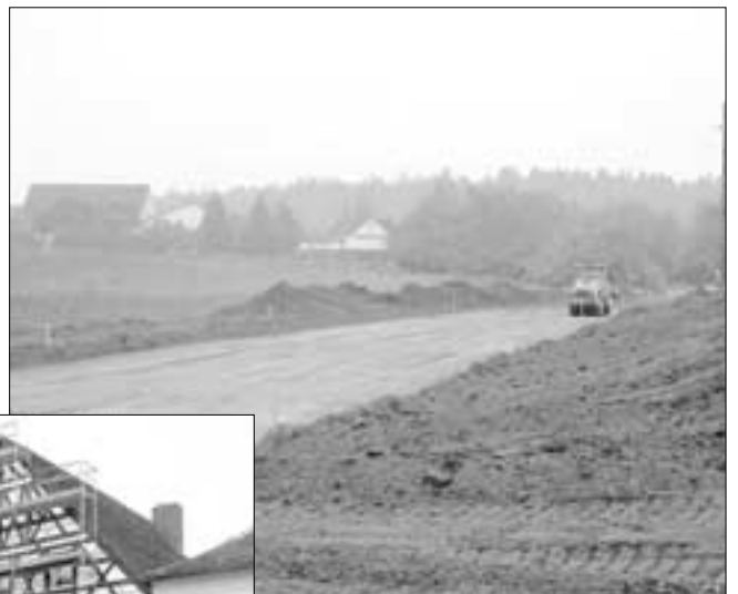
Baubeginn Straßenbau Rothenberg