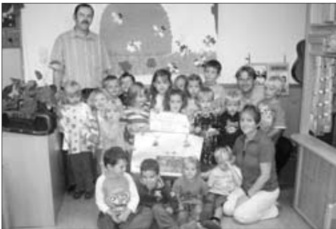
Monheim den, 20.09.06

Die Kindergartenkinder sagen herzlichen Dank!!!