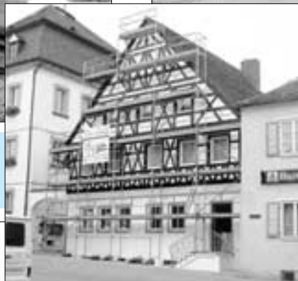
Neue Fassade für Schindlerhaus