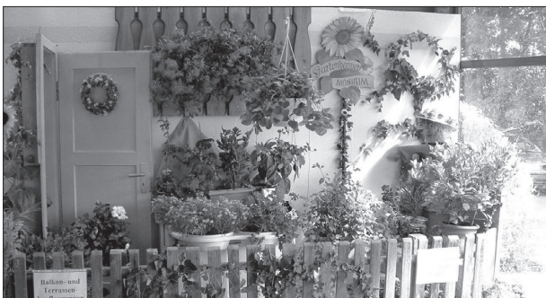
Der Stand des Vereins für Gartenbau und Landschaftspflege. (Text und Bild Schenk H-P, 2. Vorstand)