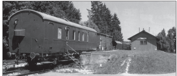
An der Rampe in Monheim (Schwab) stehen nun häufig Arbeits- und Gerätewagen des Vereins „Bayerisches Eisenbahnmuseum e.V.“, die benötigt werden, um die auf der Nebenbahn eingesetzte Museumslokomotive sowie die Personenzüge warten zu können (1989).