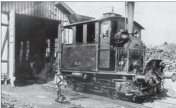
Aus der Zeit des Zweiten Weltkriegs stammt diese Aufnahme. Sie zeigt die 98 318 vor dem Monheimer Lokschuppen am 09.08.1940.

Die Gleisanlagen des kleinen Endbahnhofs verlangten reichlich Rangierarbeit, auch beim Umsetzen der Personenzüge. Zur Versorgung der Lokomotiven war eine der typischen hölzernen Kohlenbühnen vorhanden. Der Wasservorrat musste im Lokschuppen aus einen dort eingebauten Hochbehälter ergänzt werden. Nach dem Erwerb der Bahnlinie durch die Stadt Monheim ergaben sich verschiedene Veränderungen im Bahnhofsbereich. Der Lokschuppen, der in seiner ursprünglichen Form erhalten blieb, wurde zum Wohnhaus mit LKW-Garage, nachdem das Zufahrtsgleis abgebaut worden war. Entfernt wurde auch das Freiladegleis auf der gegenüberliegenden Seite. Verschwunden ist ferner das Einfahrsignal bayerischer Bauart, das vom Lokschuppen aus bedient wurde. Zweckentfremdet wurden das kleine Empfangsgebäude und der größere hölzerne Güterschuppen. Beide Gebäude sind vermietet. Sie zeigen sich noch in einem sehr guten Zustand. Erhalten geblieben sind die alten handbedienten Weichen und das lange Ladegleis mit Kopf- und Seitenrampe. Dort waren im Sommer des Jahres 1988 ein offener Güterwagen und ein Arbeitswagen der Museumsbahn abgestellt. Vor dem Bahnhof wartete die kleine zweiachsige Lok mit ihrem Personenzug auf den nächsten Einsatz.