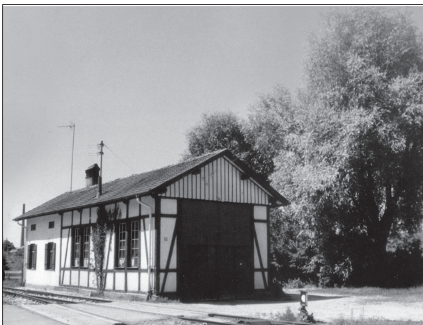
Der Lokschuppen in Monheim besitzt keinen Gleisanschluss mehr. Er dient heute als LKW-Garage mit Wohnhaus (1989).