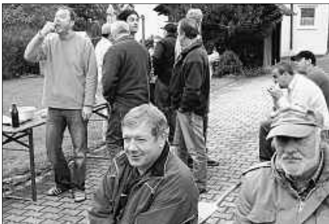
Nach getaner Arbeit!