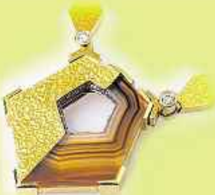
"Goldschmiedearbeiten" von Sebastian König