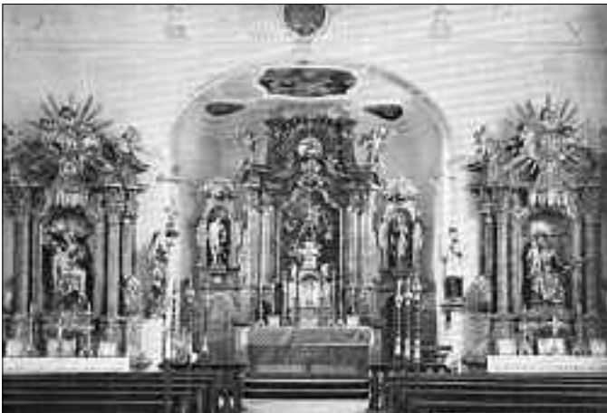
Kath. Pfarrkirche. Inneres gegen Osten