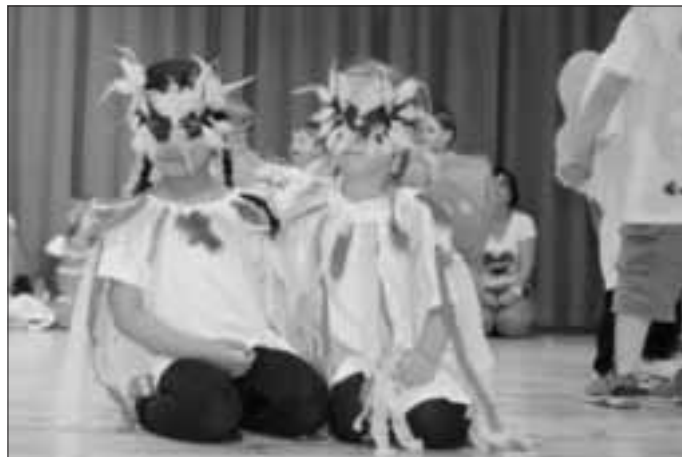
Tock, tock, tock, da klopft doch was im Ei...