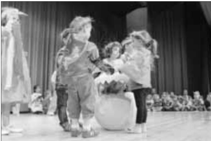
und schon bald kam der Nachwuchs...