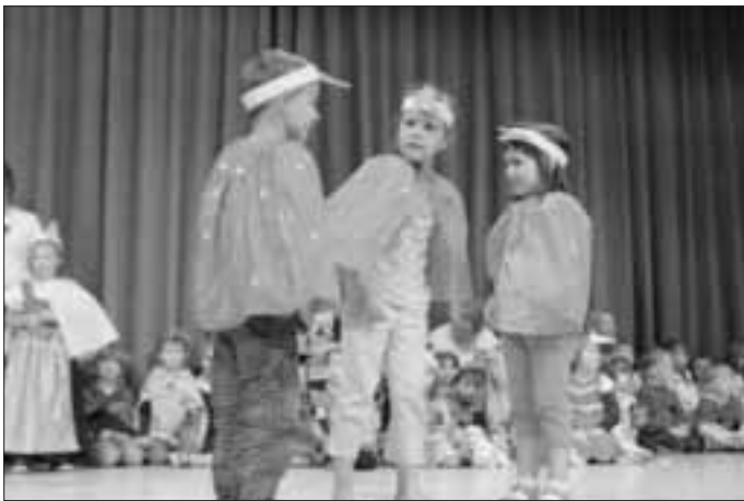
Nun war die Vogelfamilie zu dritt...