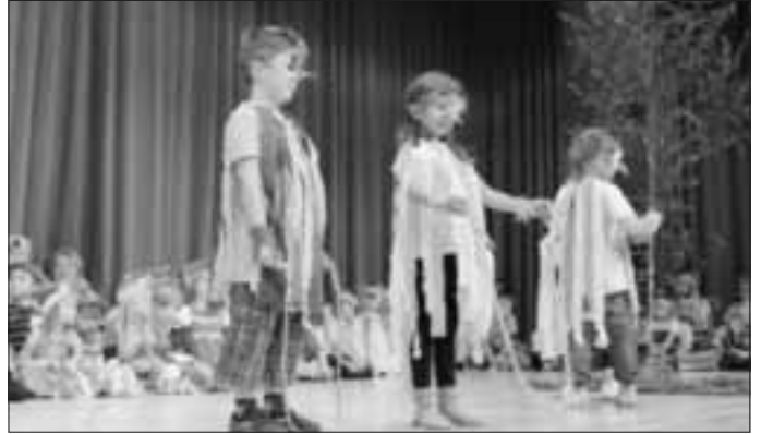
... und jeden Abend sang die Vogelmutter ein Schlaflied...