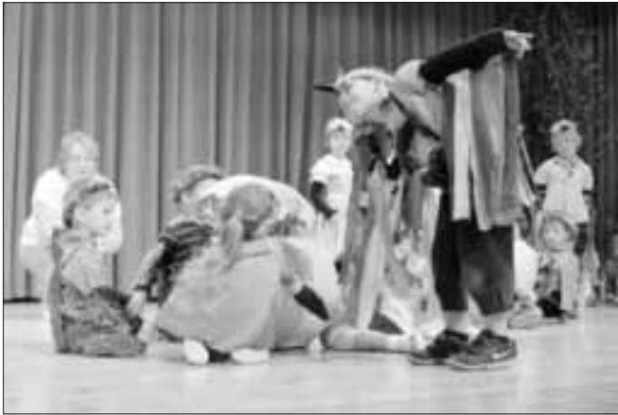
Die Vogeleltern hatten viel zu tun...