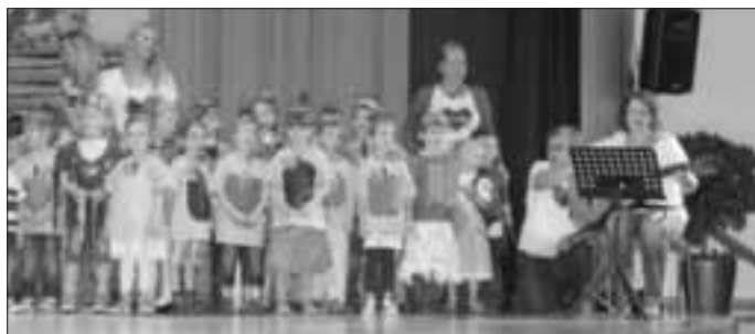
Zwei Vögel lernten sich beim Tanzen kennen...