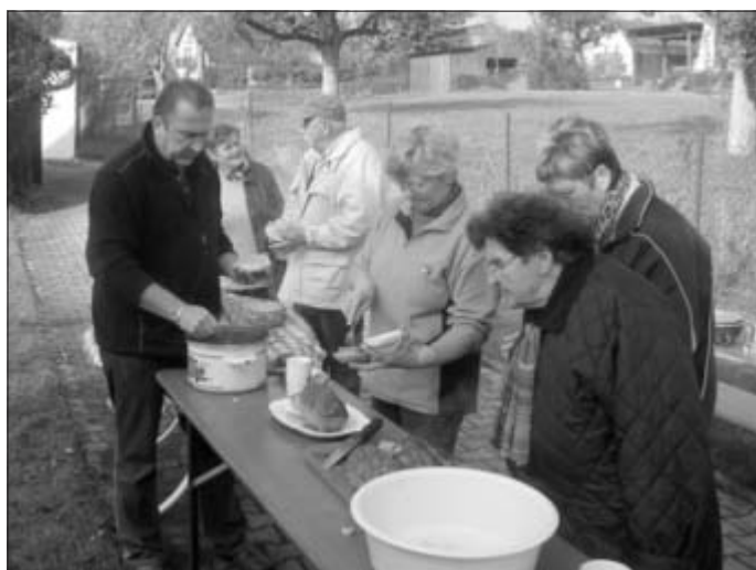
Eine Stärkung muss sein