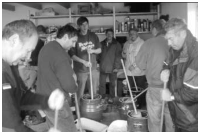
Bei der Arbeit