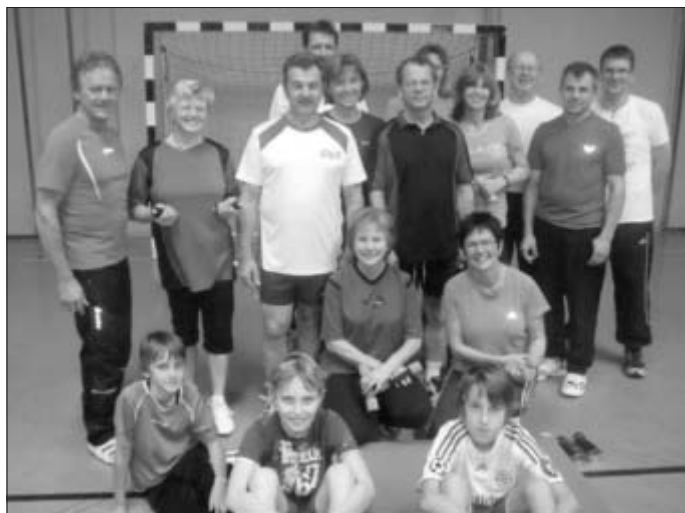
Wir sind bereit!