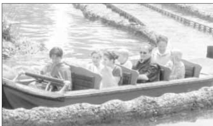
28 Ministranten und Ministrantinnen aus der Pfarrei St. Walburg machten am 19. Mai einen Ausflug in das LEGOLAND® nach Günzburg.