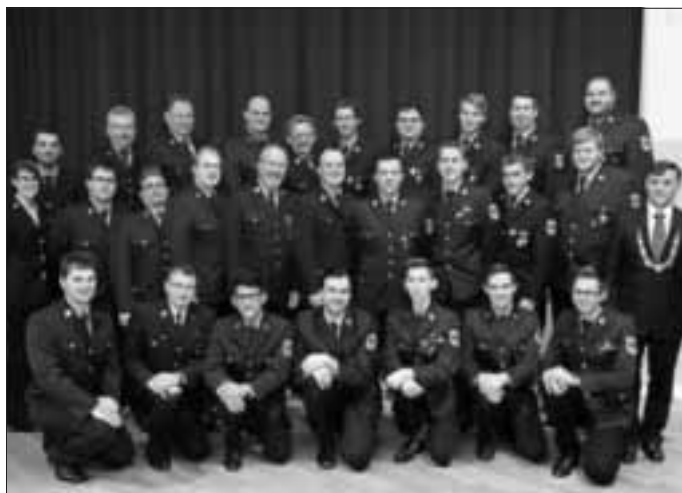
Die Freiwillige Feuerwehr Monheim