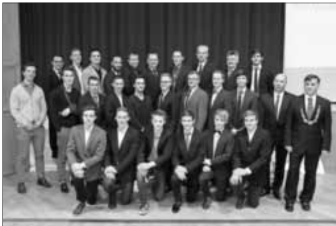
Die Mannschaft des Jahres TSV Monheim Turnen