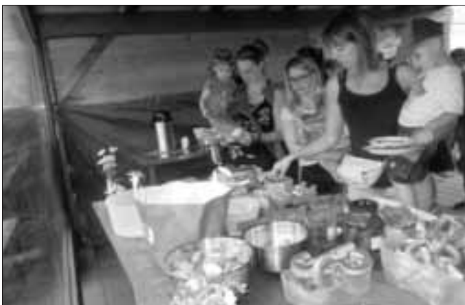
gemeinsames Essen im Pavillon

Im Anschluss daran stärkten sich alle Anwesenden an den reichlich mitgebrachten Speisen.