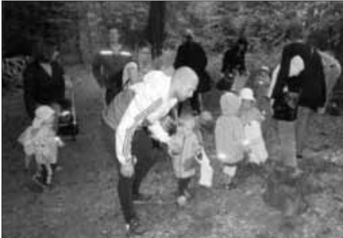
gemeinsam durch den Wald

Am Freitag, den 7. Juli 2017, fand die diesjährige Waldrallye der Kinderkrippengruppen Spatzennest und Flohkiste statt.