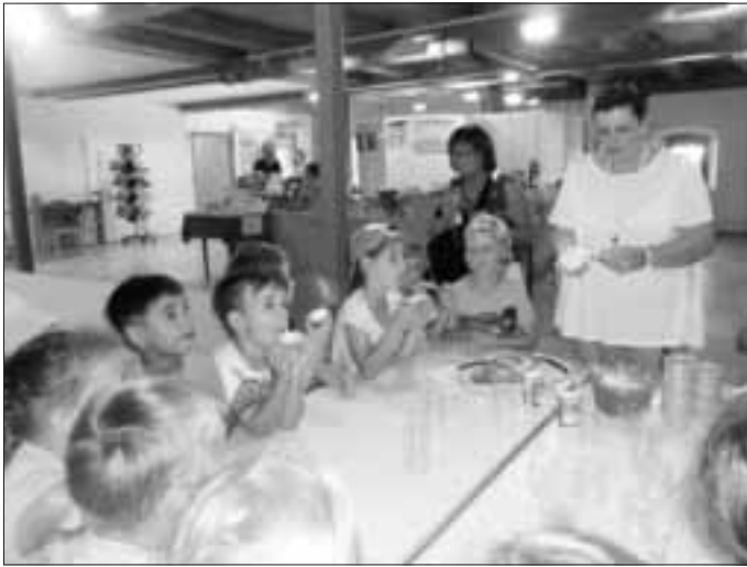
Verkosten der selbstgemachten Butter Vielleicht auch das Ziel Ihres nächsten Familienausfluges?