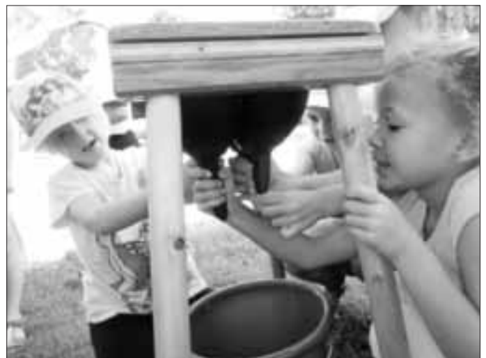
Melken ist gar nicht so einfach

Natürlich durfte das selbst Ausprobieren nicht fehlen und so konnten sich die Kinder beim Melken, Buttern und Kräuter sammeln üben.