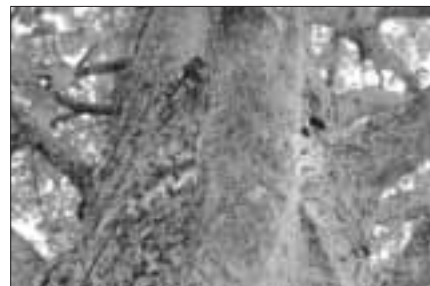
Nest Eichenprozessionsspinner

Neben forstlichen Schäden geht vom Eichenprozessionsspinner in den befallenen Gebieten eine gesundheitliche Gefährdung für den Menschen aus. Ab dem dritten Larvenstadium bilden seine Raupen Brennhaare aus, die innen hohl sind und das Eiweißgift Thaumetopoein enthalten. Bei Hautkontakt lösen diese Haare (pseudo-)allergische Reaktionen aus, die zu Hautirritationen, Augenreizungen, Fieber, Schwindel und in Einzelfällen sogar zu allergischen Schocks führen können. Beim Einatmen der feinen Härchen können zudem Atembeschwerden wie Bronchitis und Asthma auftreten. Leider gibt es bislang keine speziellen Medikamente gegen die Reaktion auf das Thaumetopoein, lediglich die Symptome können gelindert werden (etwa mit Antihistaminika und kortisonhaltigen Salben). Die Anzahl und Länge der Brennhaare nimmt mit jeder Häutung der Raupen weiter zu. Sehr viele Haare verlieren sie während der Fraßzeit im Mai und Juni, wenn sie besonders mobil sind. Ein großes Problem besteht darin, dass die Brennhaare lange Zeit giftig bleiben und auch Jahre nach einem Befall noch Reaktionen beim Menschen verursachen können. Auch die Gespinnstester aus Spinnfäden, Kot und Häutungsresten können über mehrere Jahre erhalten bleiben. Die dünnen Härchen werden vom Wind in die Umgebung getragen und reichern sich dort am Boden an. Meist kommen Menschen daher mit den Brennhaaren in Berührung, während sie sich in der Nähe befallener Bäume aufhalten oder an ihnen vorbei spazieren, besonders an windigen Tagen.