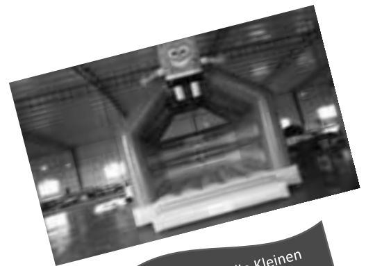
Hupfburg für die Kleinen

Abends: Fisch - und Grillspezialitäten wie mittags.