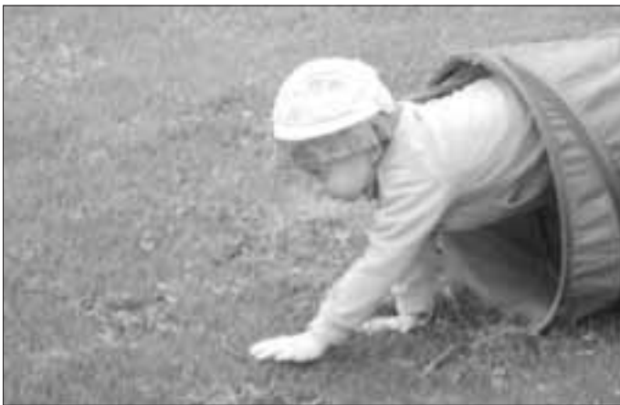
Station auf dem Sportplatz

Nachdem die Eltern und Großeltern mit ihren Kleinen mehrere Sammelstationen im Wald besucht hatten, konnte ein großes Naturmandala am Sportplatz gelegt werden.