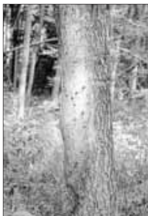
Nest Eichenprozessionsspinner

Der Eichenprozessionsspinner kommt fast ausschließlich auf Bäumen der Gattung Quercus (Eiche) vor. Er besiedelt bevorzugt Eichenwälder, deren Waldränder und Einzelbäume, kommt aber auch in lichten Eichen-Hainbuchenwäldern und Eichen-Kiefernwäldern sowie in Ausnahmefällen an weiteren Laubbaumarten vor. Besonders günstige Bedingungen findet der Eichenprozessionsspinner in warm-trockenen Regionen. Auf den befallenen Bäumen fressen die Raupen die frisch ausgetriebenen Blätter meist vollständig bis auf die Mittelrippe ab.