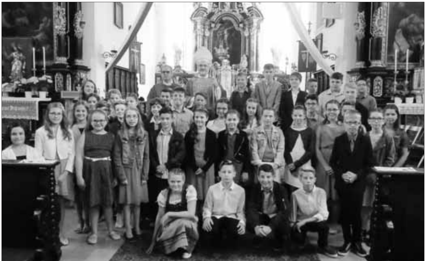
47 Jugendliche bei ihrer Firmung in Monheim