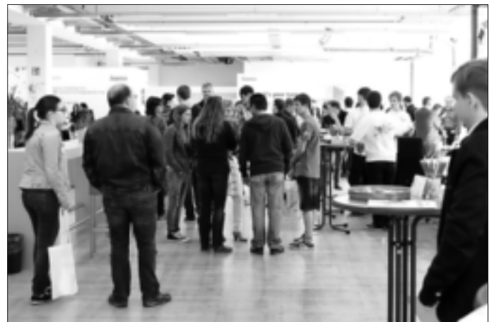
Eindrücke vom Hama Experience Day 2015, bei dem sich zahlreiche Schüler und deren Eltern über die Ausbildungsmöglichkeiten des Monheimer Unternehmens informierten.

Anmeldungen sind möglich unter www.hama.de/experienceday