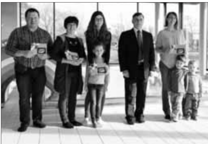
Bürgermeister Günther Pfefferer bei der Übergabe der Kundenkarten an die glücklichen Gewinner

Das alte Monheimer Hallenbad wurde nach einer umfassenden Generalsanierung als neues JURABAD Monheim vor kurzem wieder eröffnet. In diesem Zusammenhang hat die Stadt Mon- heim daher alle Bürgerinnen und Bürger dazu eingeladen, sich am Ideenwettbewerb zur Findung eines geeigneten Namens für das neue Hallenbad zu beteiligen.