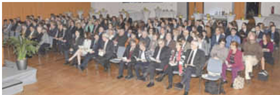
Ehrgäste beim Neujahrsempfang 2017