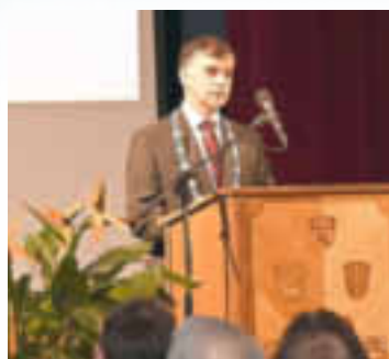
Der Gastgeber: Bürgermeister Günther Pfefferer