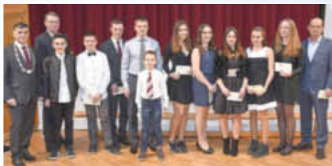
Mannschaft des Jahres: TSV Monheim Karate