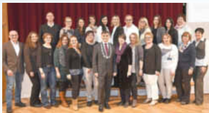
Ehrenamt des Jahres: Elternbeiräte Städt. Kindergarten / Kinderkrippe und Grundschule/Mittelschule Monheim