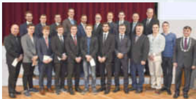
Mannschaft des Jahres: TSV Monheim Turner