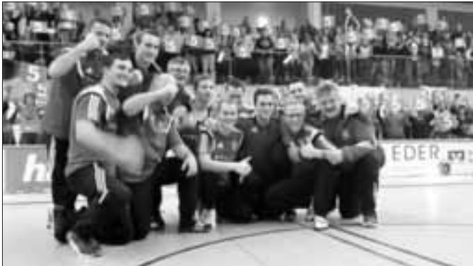
Die gesamte Mannschaft des TSV Monheim