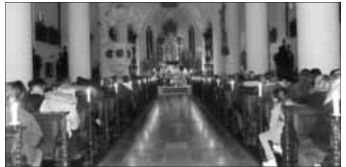
Kirche St. Walburga im stimmungsvollen Kerzenlicht beim festlichen Advenstkonzert 2015