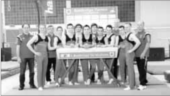
Die Mannschaft des TSV Monheim tritt dieses Jahr zum wiederholten Male in der 1. Bundesliga der Deutschen Turnliga an.

Der Vorverkauf für Tagestickets und Saisonkarten für die Heimwett-kämpfe läuft bereits unter www.tsv-monheim.com . Zu den Auswärts-wettkämpfen werden gegebenenfalls wieder Fanbusse eingesetzt – Ankündigung sowie Anmeldung ebenfalls unter www.tsv-monheim.com . Der TSV Monheim freut sich schon sehr zusammen mit den Fans zum wiederholten Male das Abenteuer 1. Bundesliga zu bestreiten!