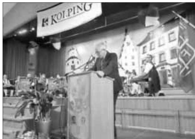
Begrüßung durch den Vorsitzenden – mit Festkapelle im Hintergrund

Im Anschluss marschierte der Festzug unter musikalischer Begleitung der Stadtkapelle, bei strahlendem Sonnenschein von der Kirchstraße zur Stadthalle.