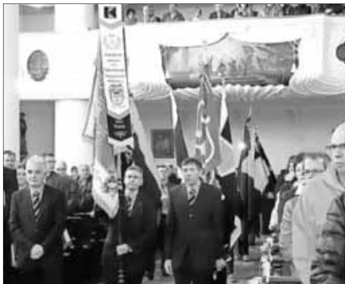
Einzug der Fahnen-/ Bannerabordnungen in die Kirche