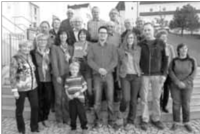
(Bericht und Bild: Norbert Meyer)

Zum Grillfest mit Freunden und Gönnern trafen sich die Mitglieder des SPD Ortsvereins Monheim mit ihren Familien im neu erbauten Vereinshaus in Tagmersheim.