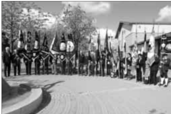
Fahnenabordnungen vor der Stadthalle

So trafen wir uns am Sonntag, den 27. September mit Vertretern und Geistlichen des Kolping-Verbandes bzw. der Diözese Eichstätt, den Kolpingsfamilien des Bezirks Weißenburg bzw. des Diözesanverbandes Eichstätt, örtlichen Vertretern des öffentlichen Lebens sowie Vereinen/ Verbänden, unseren Mitgliedern, Unterstützern, vielen Freunden und weiteren Gästen an der Stadthalle, um entsprechend unserer katholischen Wurzeln und Überzeugung gemeinsam die Messe in der Stadtpfarrkirche Monheims und am Nachmittag den Festakt zu feiern.