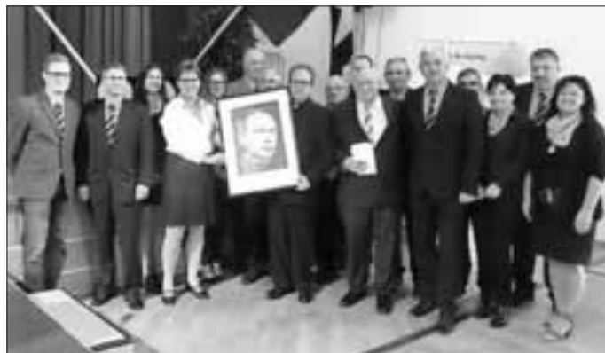
(Überreichung des Portraits von Adolph Kolping durch den Vertreter des Bundesvorstands an die Vorstandschaft)

Nach einem humorvoll gestalteten Vergleich zwischen Monheim in Bayern und seiner Heimatstadt am Rhein sowie dem besonderen Verhältnis der Städte Düsseldorf und Köln (wegen der geografischen Lage bzw. Nähe des nördlichen Monheims zu diesen) überreichte er im Namen des Bundesvorstands ein Portrait unseres Gesellenvaters.