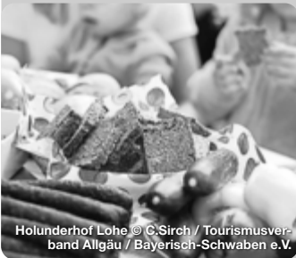
Holunderhof Lohe

Die Ausflugs- und Kurzurlaubsregion Bayerisch-Schwaben erstreckt sich vom Nördlinger Ries über das Schwäbische Donautal, die Fuggerstadt Augsburg und das LEGOLAND® bis ins Wittelsbacher Land. Radwege in idyllischen Flusslandschaften sowie Wander- und Themenwege durch die vielfältige Natur machen die Region zu einem beliebten Ziel für große und kleine Aktivurlauber. Zwischen prächtig-glanzvoll und verträumt-gemütlich präsentieren sich die Städte und Orte Bayerisch-Schwabens. Entlang der Romantischen Straße lassen sich viele Highlights verknüpfen. Kulturfans und Familien genießen das besondere Flair der historischen Stadtkulissen, Burgen und Straßenzüge, begeben sich auf die Spuren von Römern, Fuggern & Co. TreffpunktDeutschland.de/bayerisch-schwaben