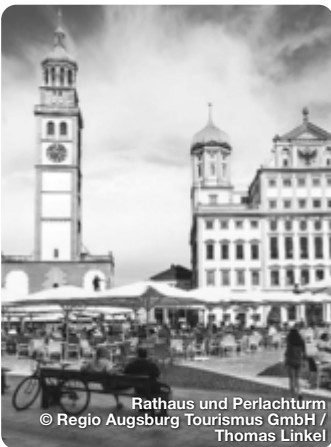
Rathaus und Perlachturm