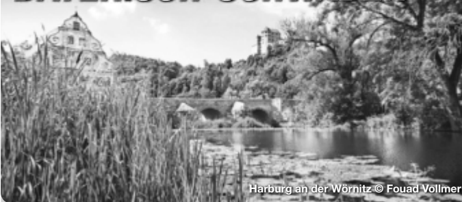
Harburg an der Wörnitz

Die Ausflugs- und Kurzurlaubsregion Bayerisch-Schwaben erstreckt sich vom Nördlinger Ries über das Schwäbische Donautal, die Fuggerstadt Augsburg und das LEGOLAND® bis ins Wittelsbacher Land. Radwege in idyllischen Flusslandschaften sowie Wander- und Themenwege durch die vielfältige Natur machen die Region zu einem beliebten Ziel für große und kleine Aktivurlauber. Zwischen prächtig-glanzvoll und verträumt-gemütlich präsentieren sich die Städte und Orte Bayerisch-Schwabens. Entlang der Romantischen Straße lassen sich viele Highlights verknüpfen. Kulturfans und Familien genießen das besondere Flair der historischen Stadtkulissen, Burgen und Straßenzüge, begeben sich auf die Spuren von Römern, Fuggern & Co. TreffpunktDeutschland.de/bayerisch-schwaben