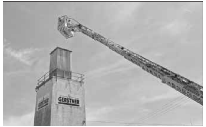
Am Gerstner Bunker in luftiger Höhe