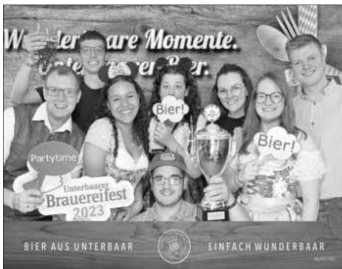
Bilder aus der Fotobox