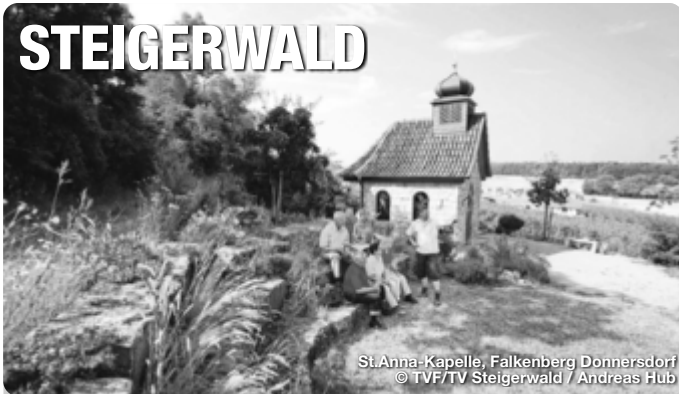
St. Anna-Kapelle, Falkenberg Donnersdorf

Reiseführer. Reisemagazine. Freizeittipps. Alle Termine und Angaben unter Vorbehalt!