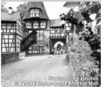
Rödelseer-Tor Iphofen

STEIGERWALD Der Steigerwald ist eine Region, die mit ihrer Vielfalt überrascht: Alte Wälder, sonnige Weinberge, historische Städtchen, male- rische Dörfer, Flüsse und Teiche, Höhen und Weite. Eine Natur, die anregt zum Haltmachen, zum Genießen, zum Erleben. Hier treffen Sie auf Buchenwälder, die in ihrer Art und Ursprünglich- keit einmalig in ganz Deutschland sind. Hier wird deutlich, was Kulturlandschaft bedeutet: Erbe, das bereichert, Gegenwart, die verzaubert. Zeit für die fränkische Vielfalt - landschaftlich, kulturell und nicht zuletzt kulinarisch bietet der Steigerwald eine einzigartige Vielfalt – ob im goldenen Herbst, in der Winterzeit bei traumhaften Weihnachtsmärkten oder beim Frühlingserwa- chen. TreffpunktDeutschland.de/steigerwald