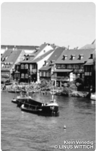
Klein Venedig

Bamberg Erleben Sie eine Stadt voller Geschichte und Kultur, im Mittelalter erschaffen und bis heute erhalten. Die Bamberger Altstadt gehört seit 1993 zum UNESCO Weltkulturerbe und begeistert mit ihren histori- schen Gassen und Plätzen, Kirchen und Bürgerhäusern aus Barock und Mittelalter.