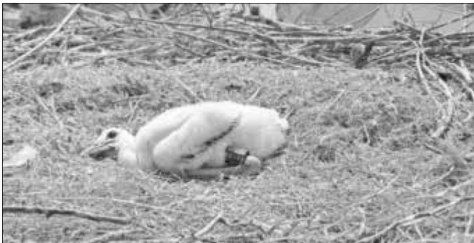
Eines der beringten Storchenküken in Monheim

(Text Wolfgang Wild)