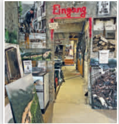
... die außer vielen Bildern auch mehrere Filmsequenzen beinhaltet.

AHRTAL. AFi. Auch fast zwei Jahre nach der verheerenden Flut ist das Ausmaß der Schäden entlang der Ahr weiterhin gegenwärtig. An vielen Stellen sieht es auf den ersten Blick noch immer nicht danach aus – doch es geht voran. Inhaber von Hotels, Restaurants und Geschäften haben, samt ihrer Mitarbeiter*innen, unzählige Stunden Arbeit, verbunden mit viel Hoffnung und Mut, in den Wiederaufbau ihrer geschäftlichen Existenzen gesteckt. Das Ziel: Endlich wieder zahlreiche Tages- und Übernachtungsgäste sowie Kundinnen und Kunden begrüßen zu können. Wanderfreudige Besucher*innen des Ahrtals dürfen sich, neben unvergesslichen Stunden in grandioser Natur entlang