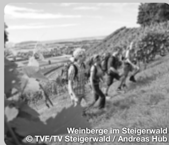
Weinberge im Steigerwald