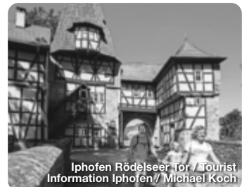
Iphofen Rödelseer Tor / Tourist Information Iphofen // Michael Koch

Ein Rundgang durch das Fränkische Freilandmuseum ist wie eine Zeitreise durch 700 Jahre fränkische Alltags- geschichte: Über 100 Gebäu- de, Bauernhöfe, Handwerker- häuser, Mühlen, Schäfereien, Brauereien, Amtshaus, Schul- haus und Adelsschlösschen, Scheunen, Ställe, Back- und Dörrhäuschen laden ein zur Entdeckungsreise in die Ver- gangenheit. Sie vermitteln, wie die ländliche Bevölkerung in Franken früher gebaut, ge- wohnt und gearbeitet hat. Erkenbrechtallee 1, Bad Windsheim