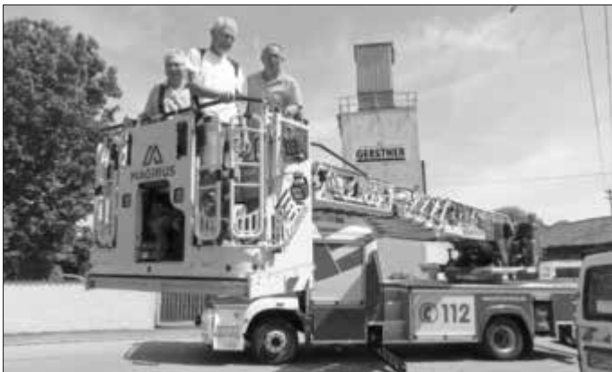
Mit der Drehleiter geht's nach oben - ein Dank die Feuerwehr