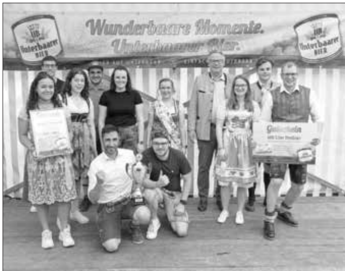
Preisverleihung durchgeführt von Freiherr Groß von Trockau