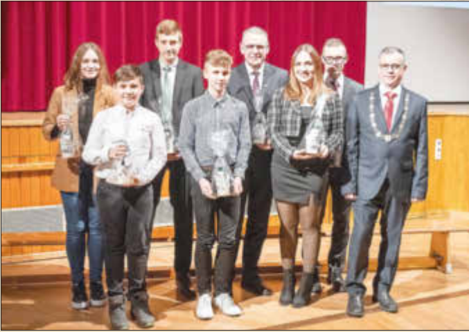
TSV Monheim 1895 e. V. - Karate