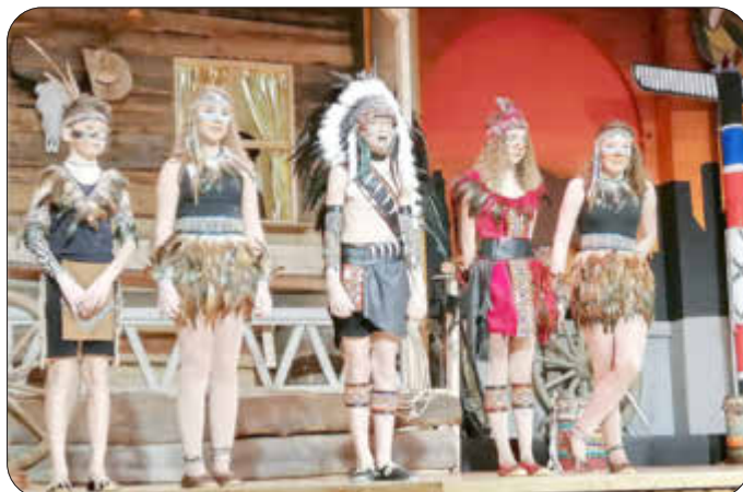
Der Kinderhofstaat in Aktion