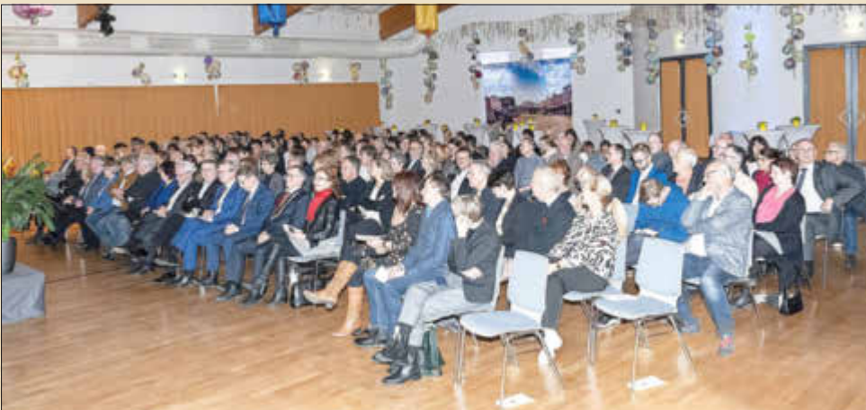
Gäste beim Neujahrsempfang 2023