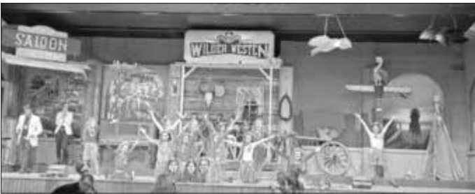
Tanzmäuse der FG Gailachia