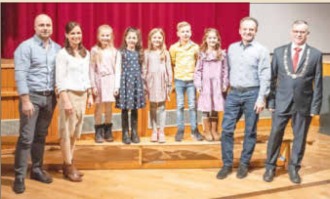
TSV Monheim 1895 e. V. - Turnen