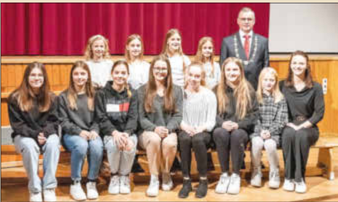
TSV Monheim 1895 e. V. - Sportakrobaten