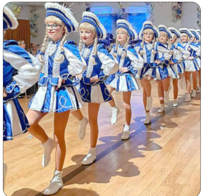
Hübsche Mädels mit flotten Tänzen beeindruckten die Gäste