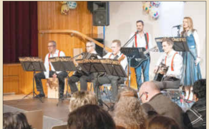
Sehr gute musikalische Umrahmung durch die musimacherei