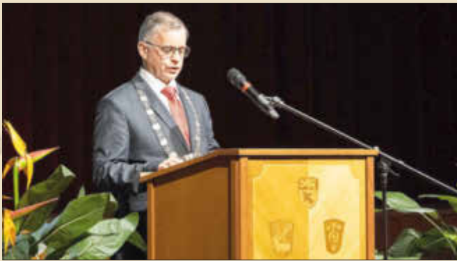
Bürgermeister Günther Pfefferer

Außerdem würdigte der Bürgermeister die bayerischen Meister 2022 des TSV Monheim der Sparten Karate, Sportakrobatik und Turnen, sowie die Stadtmeisterin 2022 der Schützen.