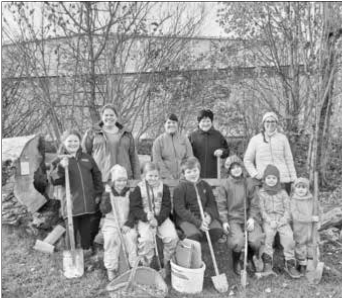
Die fleißigsten Zwiebelpflanzer 2022