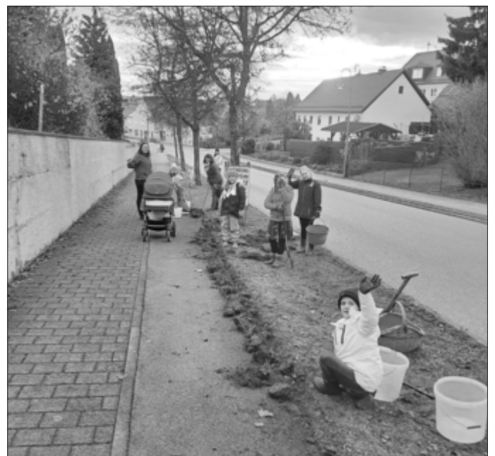
Zwiebelpflanzexperten bei der Arbeit

Am Samstag, den 5. November trafen sich 14 Erwachsene und neun Kinder am Lehrbienenstand, um zu einem ersten Einsatz auszuschwärmen. Nach knapp zwei Stunden waren fast 10.000 Blumenzwiebeln in der Fläche vor unserer Dampfloek versteckt.