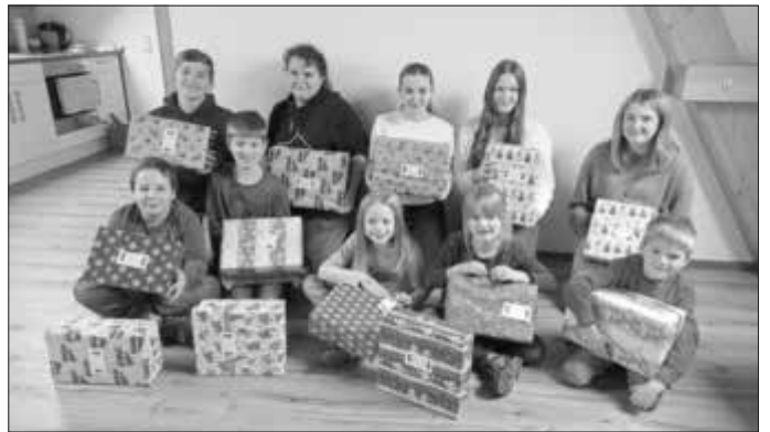
(Text und Foto: Sabine Hertle)

3 x ab Donnerstag, 15.12.2022 , 18:00-21:00 Uhr, € 51,00 (zzgl. Materialkosten), Grund- und Mittelsch. Monheim, - Katerina Müller, VHS-Dozentin (Text: Sabine Meier)