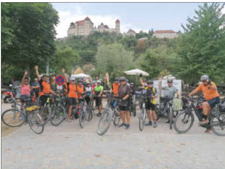
Abschlussfahrt am 24.07.2022 „Sternfahrt“ nach Harburg

Die Stadt Monheim hat zum zweiten Mal am bundesweiten Wettbewerb „Stadtradeln“ teilgenommen. Im Zeitraum vom 4. Juli bis 24. Juli 2022 ging es darum, möglichst viele (Alltags-) Wege klimafreundlich mit dem Rad zurückzulegen und somit aktiv CO 2 einzusparen.