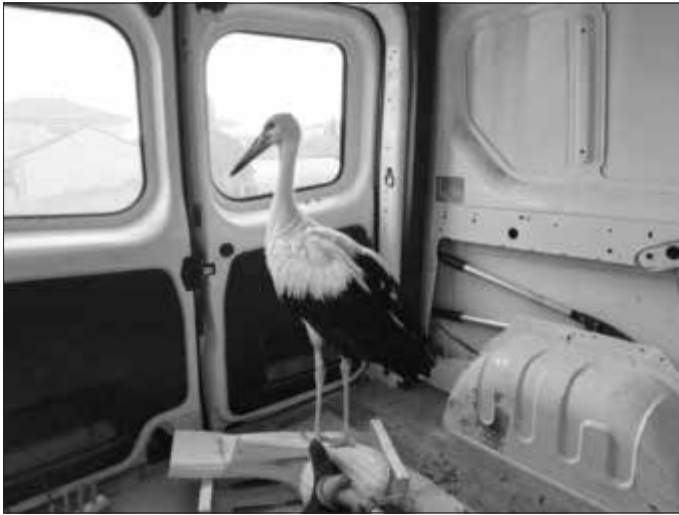
Storchentransport im Auto