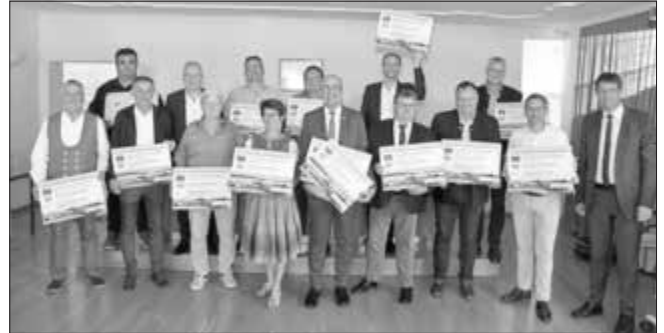
Gruppenbild der dreizehn Kommunen und deren Vertretern, die in Schwaben mit 9,3 Millionen Euro gefördert werden.

Herr Ferber Markus MdEP war Gast bei der Veranstaltung und richtete in seinen Grußworten an die Anwesenden ein großes Lob für das Engagement und die gute Ausarbeitung. Er gratulierte anschließend den dreizehn Kommunen und deren Vertreter, die in Schwaben mit 9,3 Millionen Euro gefördert werden.