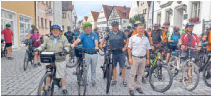
Das „Anradeln“ am 04.07.2022