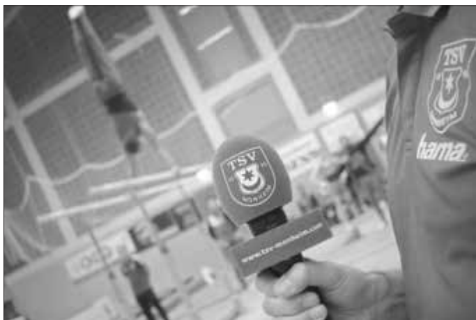
Ab September starten die Turner vom TSV Monheim wieder in der 2. Bundesliga Süd.