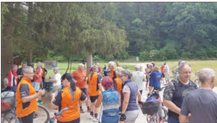
Pause am Drei-Länder-Eck