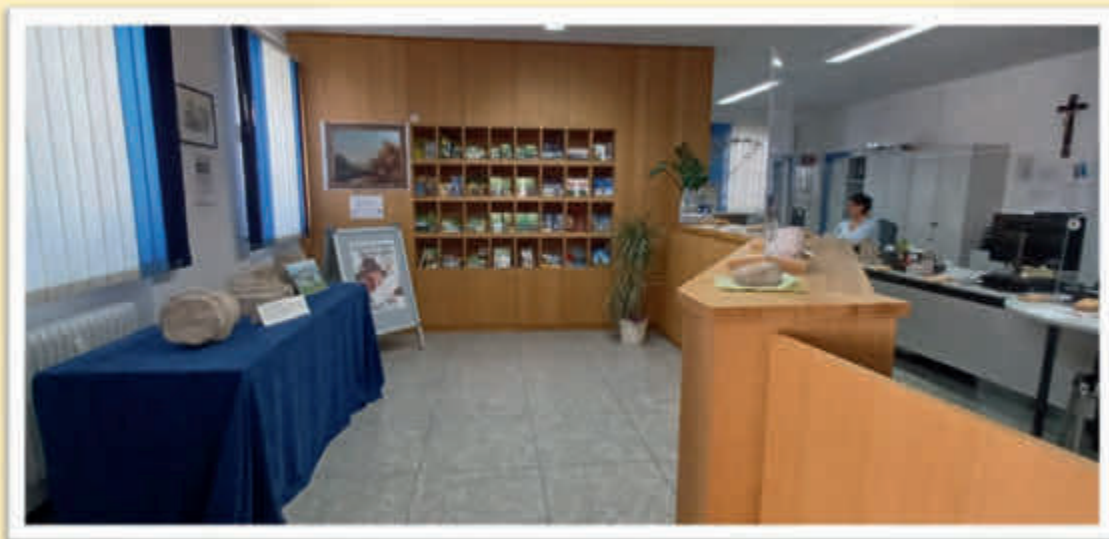
Hauptraum der Tourist-Information mit großer Prospektwand