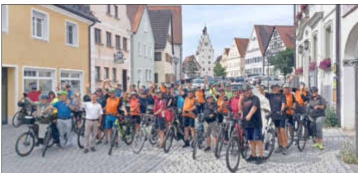
Gemeinsame Abfahrt beim Anradeln in Monheim