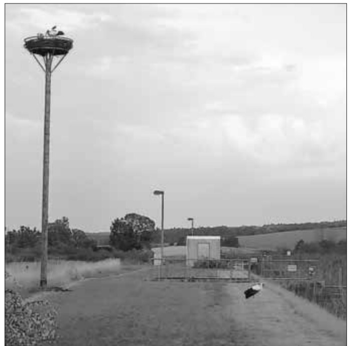
In der Nähe seiner Eltern (oben im Nest) wurde er ausgesetzt