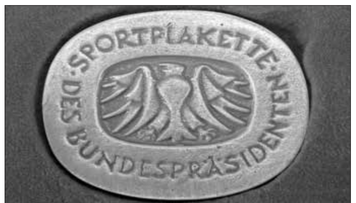
Die eindrucksvolle Plakette

Die Sportplakette des Bundespräsidenten stellt die höchste Auszeichnung für Turn-, Sport-, und Schützenvereine in der Bundesrepublik Deutschland dar. Es werden ausschließlich Vereine geehrt, die seit 100 Jahren und darüber hinaus Schießsport oder Sport anbieten. Sie wird verliehen für „die in langjährigem Wirken erworbenen besonderen Verdienste um die Pflege und Entwicklung des Sports“.