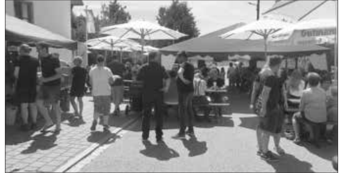
Gesellige Stunden auf dem Itzinger Dorffest

Allein dieses ehrenamtliche Engagement macht die Durchführung des Dorffestes möglich und sorgte auch heuer für einen wirklich gelungenen Tag.