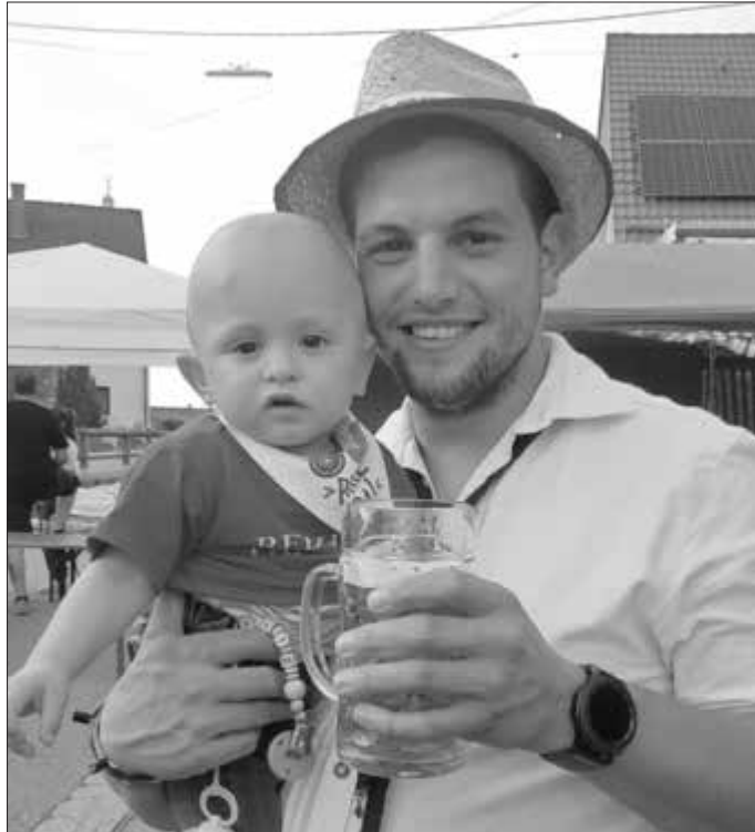
Gute Stimmung bei Groß und Klein am Itzinger Dorffest

Für die Kinder wurde tagsüber eine Hüpfburg aufgestellt, die immer gut besucht war. Und wer wollte, konnte sich nachmittags mit einem neuen „Tattoo“ verschönern lassen. So blickte man in viele freudige Gesichter.