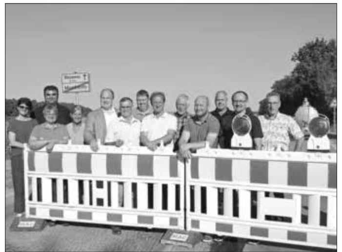
Monheims Bürgermeister Günther Pfefferer (6. von links) und MdL Wolfgang Fackler (8. von links) trafen sich an der Sperrung der Staatsstraße 2214 am Ortsende von Monheim in Richtung Warching mit Vertretern des Monheimer Stadtrats zu einem Erörterungstermin.