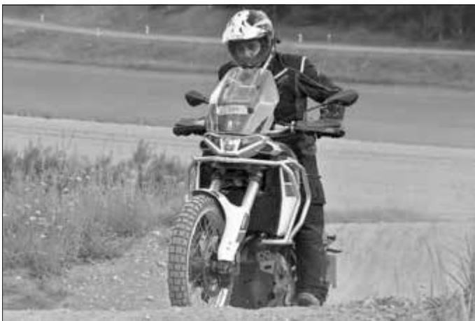
(Text und Fotos: Kai Schreiber)

Die Trainer Guido Lindenau, Ralf Schardt, Max Kern und Roland Fickel zeigten aber viele Tricks und Kniffe wie so ein Gerät auch Kräfte schonend bewegt werden kann.