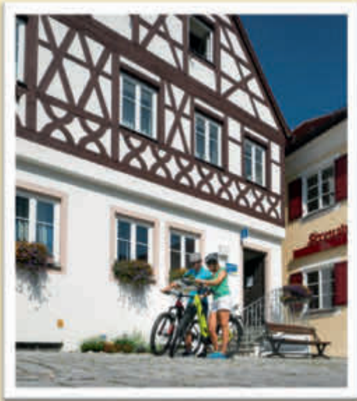
Die Tourist-Information im Schindlerhaus

Die Tourist-Information befindet sich am Marktplatz neben dem Rathaus im Schindlerhaus. Bürger und Gäste erhalten hier umfangreiches touristisches Prospektmaterial, Informationen zu den Sehenswürdigkeiten, Veranstaltungshinweise, Rad-, Wander- und Freizeitkarten zu den Urlaubsregionen Monheimer Alb, Ferienland Donau-Ries, Geopark Ries und Naturpark Altmühltal.