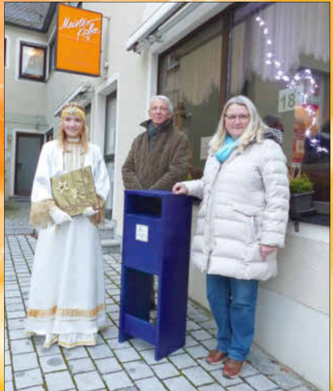
Die Losbox steht am 18. und 19. Dezember 2021 vor dem Café Wenninger in der Monheimer Innenstadt.

Die ausgefüllten Weihnachtslose können am 4. Adventswochenende – Samstag, 18. Dezember und Sonntag, 19. Dezember - in die Losbox vor dem Café Wenninger in der Innenstadt eingeworfen werden. Am Montag, 20. Dezember 2021, findet dann die Verlosung statt, welche coronabedingt nicht öffentlich abgehalten wird. Als Glücksfee wird das Monheimer Christkind (Marlene Beck) fungieren und aus allen eingegangenen Losen die glücklichen Gewinner ziehen. Diese werden von der ProGeMo umgehend telefonisch benachrichtigt. Also auf Ihrem Weihnachtslos unbedingt Ihren Namen und die Telefonnummer angeben!