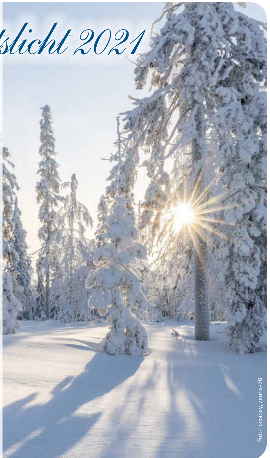
G nther Pfefferer Erster B rgermeister Stadt Monheim