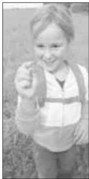
Die Liebesspeise der Wespenspinne: der Grashüpfer