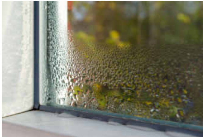
Feuchtigkeit in der Wohnung und als Ergebnis ein erhöhter Energiebedarf: Ein Austausch alter Dichtungsprofile ist dann oftmals unerlässlich.

(djd). Wie lange hält eine Fenster- oder Tüрдichtung wirklich dicht? Kaum ein Mieter oder Eigenheimbesitzer macht sich darüber Gedanken. Einmal eingebaut, verbleiben sie oft Jahrzehnte in Fenstern und Türen. Dabei haben sie in der Regel nur eine „Haltbarkeit“ von fünf bis 15 Jahren. Während Türen und Fenster eine lange Lebensdauer haben, werden Dichtungen teilweise schon nach wenigen Jahren spröde, härten aus oder sind mechanisch zerstört. Die Folge: Kälteeinbruch, Feuchtigkeit in der Wohnung und als Ergebnis ein erhöhter Energiebedarf. Ein Austausch der alten, verschlissenen Dichtungsprofile ist dann unerlässlich.