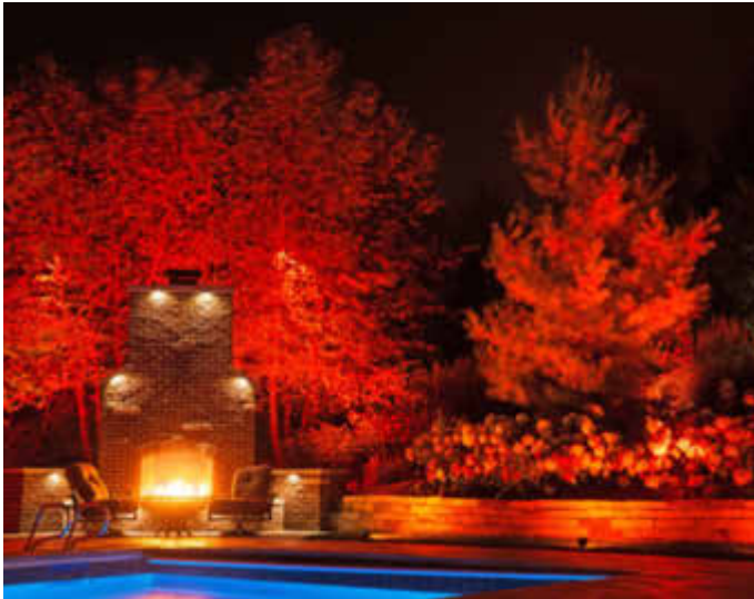
Mit der passenden Beleuchtung kommt der Garten auch bei Dunkelheit groß raus.

Mit variablen LED-Beleuchtungen für Ambiente und Sicherheit sorgen