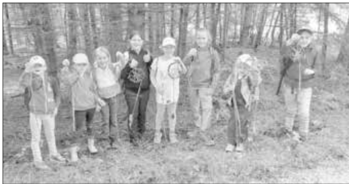
Stolz präsentieren die Kinder ihre gebastelten Traumfänger