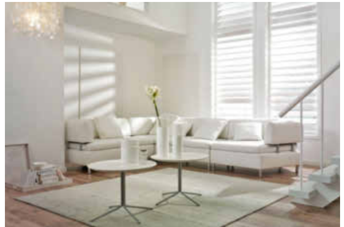
Weißer Wände lassen jeden Raum größer wirken und sorgen für eine helle, freundliche Atmosphäre.

kühl ist. Denn am besten trocknet Farbe bei warmer Luft.