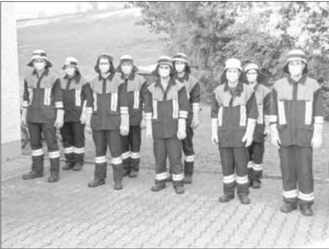
Die zweite Gruppe angetreten zur Abnahme der Leistungsprüfung