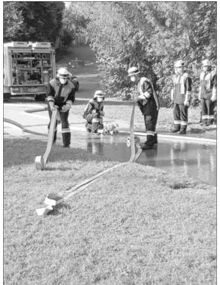
Die erste Gruppe mit vier Neueinsteigern in Aktion beim Löschaufbau