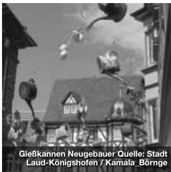
Gießkannen Neugebauer