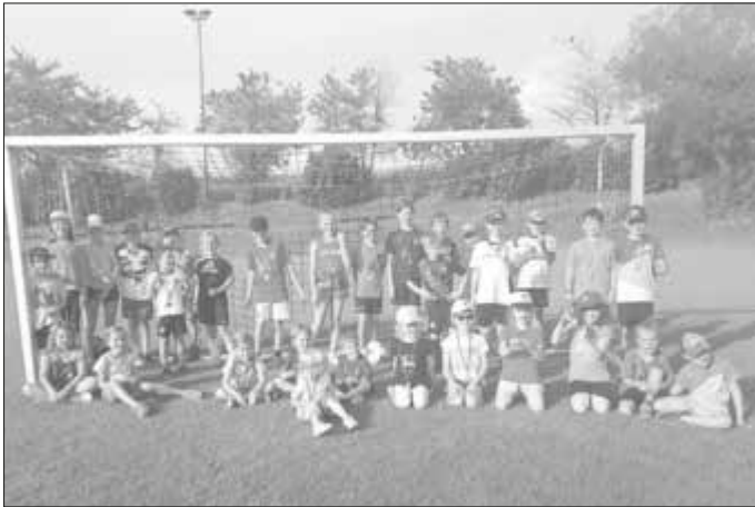
25 Kinder beim Ferienprogramm des F.C. Weilheim-Rehau Foto: s.d.

Da verwundert es kaum, dass die Stärkung am Ende mit einem leckerem Gruß aus der Küche des Sportheims alle begeisterte. (Johannes Meyr)