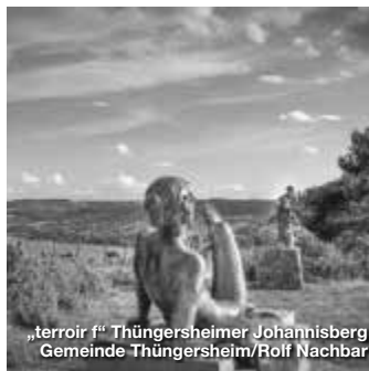
„terroir f“ Thüngersheimer Johannisberg Gemeinde Thüngersheim/Rolf Nachbar

Herrliche Weinberge, die idyllische Tauberaue und naturbelassene Wälder formen das Landschaftsbild der Stadt. Spuren von Mittelalter, Bauernkrieg, Gotik und Barock prägen Lauda-Königshofen und bieten mit Fachwerkhäusern, uralten Tauberbrücken mit Heiligenstatuen, Bildstöcken und Kirchen mit einzigartigen Kleinodien eine prächtige Kulisse. treffpunktdeutschland.de/lauda-koenigshofen