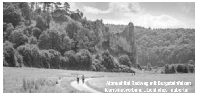
Altmühltal Radweg mit Burgsteinfelsen Tourismusverband „Liebliches Taubertal“

Entspannt radeln, die Naturvielfalt zwischen sonnigen Wacholderheiden, Felstürmen und lichten Wäldern auf verschiedenen Touren erleben und abends immer wieder in derselben gemütlichen Unterkunft ankommen – so ist es vielen Genussradlern am liebsten. Für sie hat der Naturpark Altmühltal, die abwechslungsreiche Radregion in der Mitte Bayerns, jetzt 15 neue Rundtouren konzipiert, die in der druckfrisch erhältlichen Karte „Radtouren – Tourenvielfalt und Altmühltal-Radweg erfahren“ verzeichnet sind.