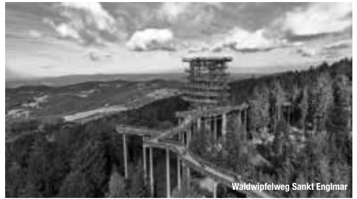
Waldwipfelweg Sankt Englmar

Auf den Spuren unserer Vorfahren – Eine spannende Zeitreise in die Welt der Neandertaler und Kelten! Beim Betreten der dunklen Klausenhöhlen im Archäologiepark Altmühltal taucht man ein in eine Welt vor über 10.000 Jahren und schickt seine Fantasie auf eine aufregende Reise in die Vergangenheit. treffpunktdeutschland.de/altmuehital