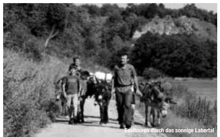
Eseltouren durch das sonnige Labertal