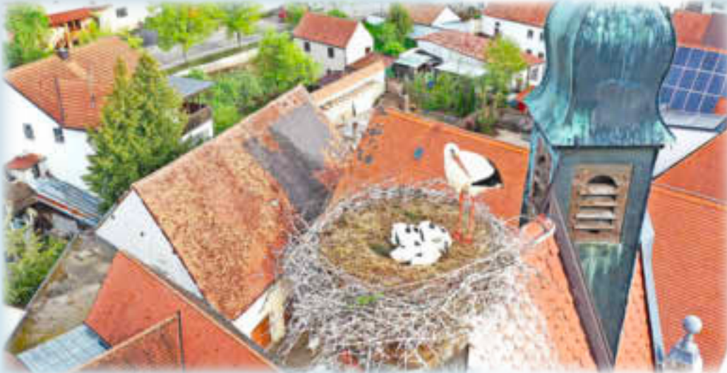
Die drei Storchenkinder am Oberen Torturm

Die Störche am Torturm haben tatsächlich drei Storchenkinder die kräftig wachsen und schon eine stattliche Körpergröße haben. Wenn alles gut geht, werden sie in dieser Woche beringt.