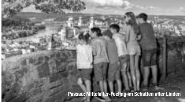
Passau: Mittelalter-Feeling im Schatten alter Linden

Reiseführer. Reisemagazine. Freizeittipps.