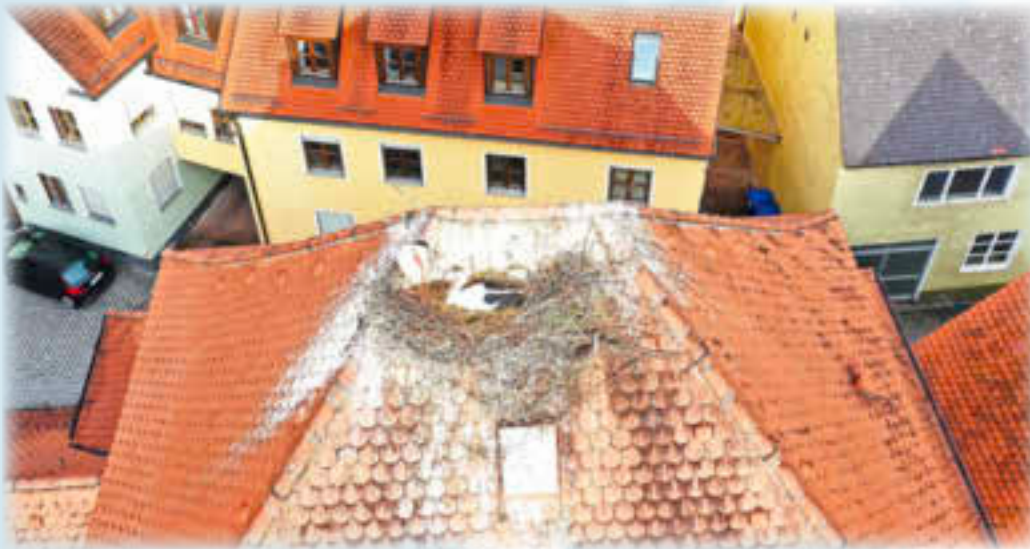
Am Pfarrhaus wird noch gebrütet

Die Störche am Torturm haben tatsächlich drei Storchenkinder die kräftig wachsen und schon eine stattliche Körpergröße haben. Wenn alles gut geht, werden sie in dieser Woche beringt.