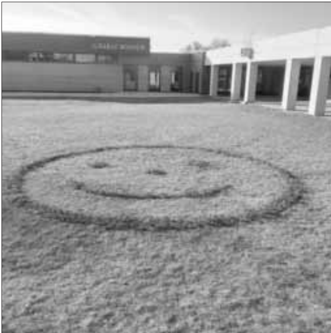
Eines der Ergebnisse aus der Zwiebelpflanzaktion: der Smiley vor dem JURABAD