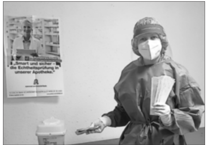
Kostenfreie Corona-Schnelltests bietet die Stadtapotheke in der Monheimer Stadthalle an