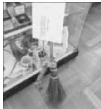
Der abgestellte Besen als Nachricht für den ausgefallenen Fasching 2021