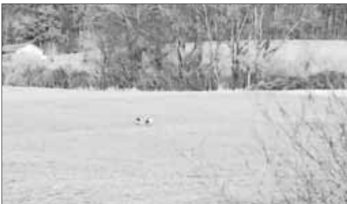
Das gesichtete Pärchen

Und kaum ist die Kaltperiode vorbei, ist er da und richtet sich sein Nest für diese Saisonliebe her. Es wurde bereits ein zweiter Storch gesichtet und so wie es aussieht, wird heuer wieder „Moni“ seine Saisonfrau.