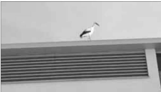
„UDO“ auf dem Dach der Kläranlage

Kaum zu glauben, aber wahr. Unser Monheimer Storch „UDO“ ist zurück aus dem Winterurlaub. Und das schon am 18. Februar. Nachdem Udo erst Anfang Oktober 2020 Monheim verlassen hat, war klar, dass er sich nur bis zum Bodensee bzw. bis max. Italien oder Spanien zurückziehen wird.