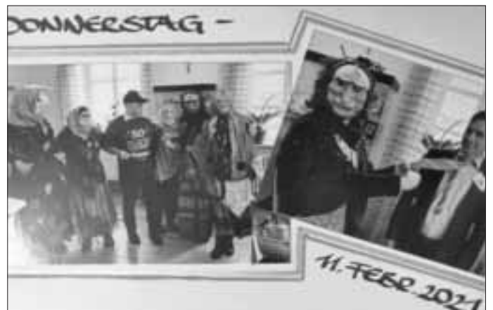
2021 gab es leider nur ein Erinnerungsfoto aus dem letzten Jahr

Aber eine mutige Einzelhexe hat für unseren Bürgermeister „ihren“ Besen abgegeben mit der Nachricht, dass die Hexen 2022 wieder in gewohnter Form einfliegen!