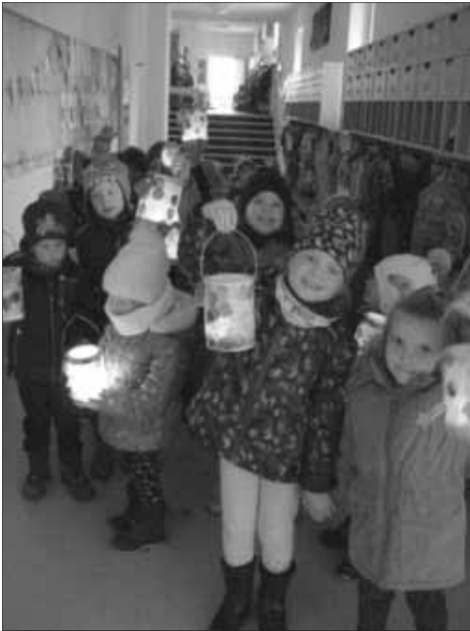
Die Kinder der Delphingruppe mit ihren Laternen Wir blicken auf ein paar schöne, individuelle Martinsfeiern zurück. (Text und Fotos: Susanne Utjesinovic)

Auch in unserem Haus hatten die Kinder die Möglichkeit, ihre Laternen zum Leuchten zu bringen.