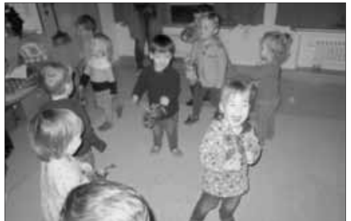
Laternenumzug der Gruppe Flohkiste (Text und Fotos: Susanne Utjesinovic)