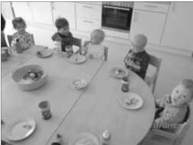
Die Kinder der Gruppe Fuchsbau beim gemütlichen Beisammensein Die St. Martinslegende durfte natürlich auch nicht fehlen und so lauschten die Kinder der Geschichte.

Wie jedes Jahr feierte die Kinderkrippe das Martinsfest. Aufgrund der aktuellen Situation konnten die drei Gruppen dies nicht gruppenübergreifend tun. So feierte jede Gruppe für sich und machte es sich erst einmal bei Brezen und Wienerle gemütlich.