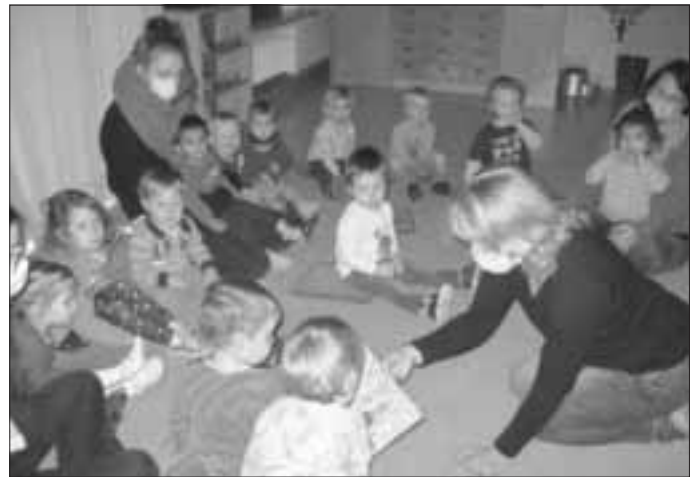
Bilderbuch St. Martin in der Gruppe Spatzennest Zum Abschluss zogen die Kinder mit ihren selbst gebastelten Laternen durch das Gruppenzimmer und den Flur.