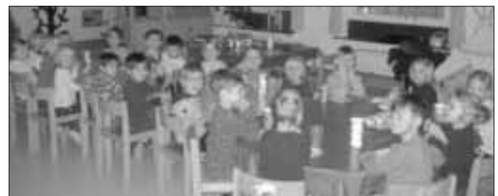
Die Schmetterlingsgruppe bei der gemeinsamen Brotzeit

Das gemütliche Beisammensein fand bei einer gemeinsamen Brotzeit in jeder Gruppe statt.