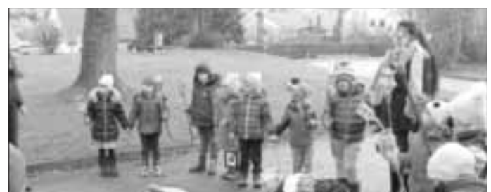
Die Mäusegruppe mit ihren Fackeln

Der Laternenumzug mit den selbst gebastelten Laternen durfte auch nicht fehlen und so zogen die einzelnen Gruppen an verschiedenen Tagen zu unterschiedlichen Uhrzeiten durchs Haus, den Garten und die nähere Umgebung des Kindergartens.