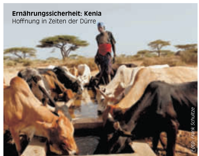
Ernährungssicherheit: Kenia Hoffnung in Zeiten der Dürre