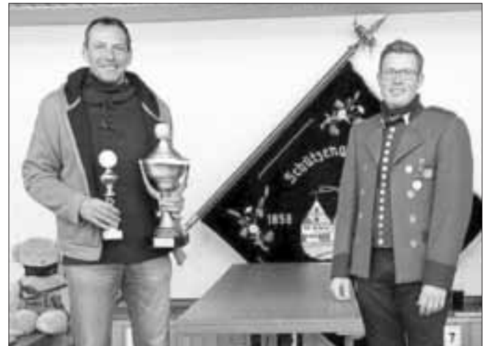
(Text und Foto: Brigitte Christ)

zenheim in einer Vitrine und einen kleinen Erinnerungspokal darf der Gewinner mit nach Hause nehmen. Platz 2 erreichte Nadine Schwertberger (71,6-Teiler) vor Otto Krist (74,5-Teiler) auf Platz 3.