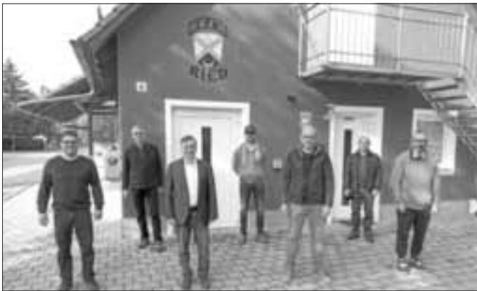
Die neu gewählte Vorstandschaft der Freiwilligen Feuerwehr Ried