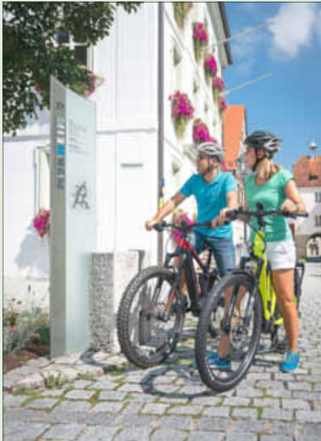
Informationen und Geschichte vor dem Rathaus