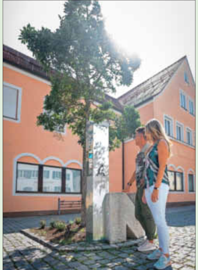
Wissenswertes rund um Monheim