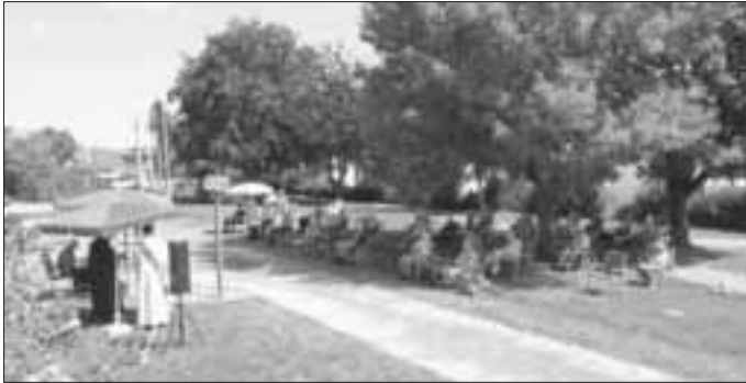
Die Senioren beim Freiluftgottesdienst