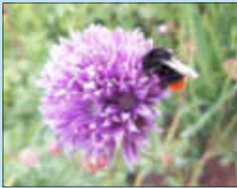
Großes Nahrungsangebot auf der Bienenweide

Die große Kräuterspirale beherbergt über 30 verschiedene Kräuter-, Gewürz-, und Heilpflanzen. Hier lassen sich die Bienen besonders gut bei der Nahrungssuche beobachten.