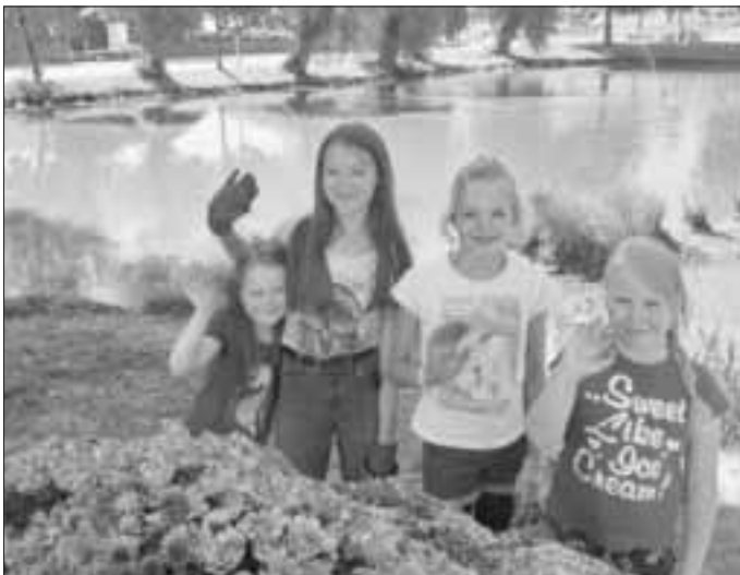
Findling Nummer 1 bepflanzt

Bis zum Ende der Ferien werden noch weitere Gruppen gemeinsam Steine bepflanzen. Eine Anmeldung ist unter info@monheim-summt.de weiterhin möglich. Vielen Dank auch noch einmal für die zahlreichen Pflanzenspenden, die wir auch weiter nach Absprache gerne entgegennehmen.