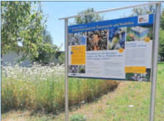
Informationen rund um den Lehrbienenstand