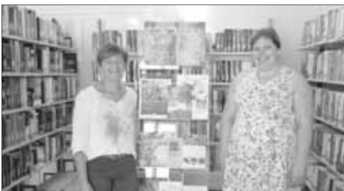
Spende der neuen Fachbücher (Text und Fotos: Renate Röding)

Vielen Dank an den Imkerverein Monheim für die großzügige Spende und an Mariele Lettenbauer und ihr Büchereiteam für die Bereitschaft, uns zu unterstützen!