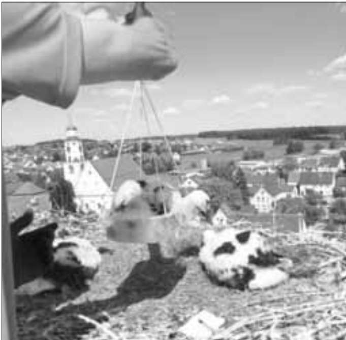
Jeder der drei Störche wiegt zwischen 2,7 und 2,9 Kilogramm

Die Störche in Deutschland werden seit 2003 mit dem ELSA-Ring beringt (European Laser Signed Advanced Ring). Das sind laser-beschichtete Kunststoffringe (schwarzer Ring mit weißer Schrift) mit einem Buchstaben-Ziffern-Code (Ringnummer), der senkrecht angeordnet 4 mal erscheint und mit einem Teleskop bis auf etwa 200 Meter Entfernung abgelesen werden kann. Drei Seiten des Ringes tragen das Kürzel für die Beringungszentrale und eine Seite trägt die Post- und E-Mail-Adresse für Finder. Die Beringung der Jungstörche (ab der 3./4. Lebenswoche), muss spätestens bis zur 6./7. Lebenswoche erfolgen, weil sie danach nicht mehr in die Akinese (Totstellreflex) fallen und die Gefahr besteht, dass sie vor Aufregung aufstehen, weg kriechen, zuschnappen oder aus dem Nest hüpfen. Durch die Beringung ist es möglich, die Störche in ihren Brutgebieten und auf den Zugwegen zu identifizieren und so ihren Lebenslauf zu erforschen.