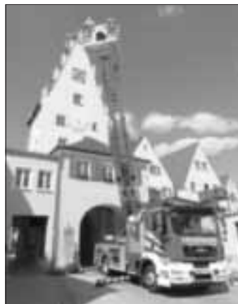
Mit der Drehleiter geht es nach oben