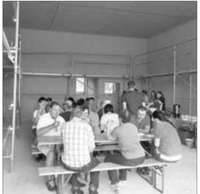
Gemütliches Beisammensein nach der Führung bei Kaffee und Kuchen

Nach der Führung wurde bei Kaffee u. Kuchen (organisiert von den Festdamen) in der neu gebauten Fahrzeughalle noch viel gefachsimpelt und es entstand sogar die Eine oder Andere gute Idee für den weiteren Ausbau.