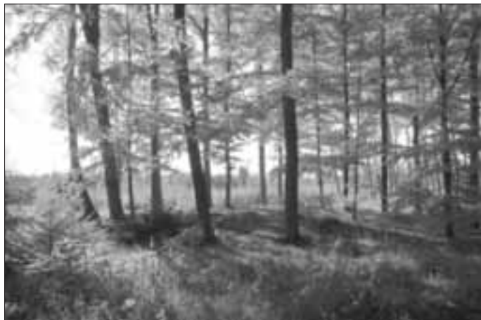
Grabhügel bei Itzing