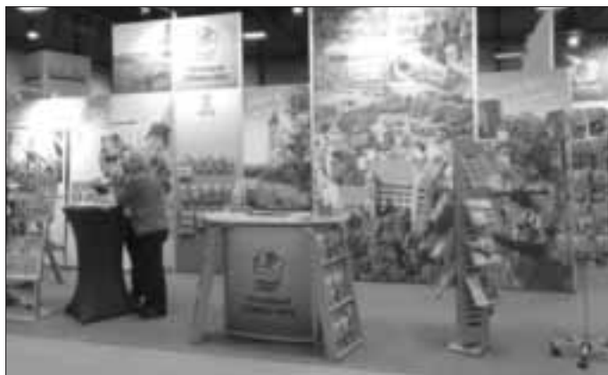
Stand vom Ferienland Donau-Ries auf der afa