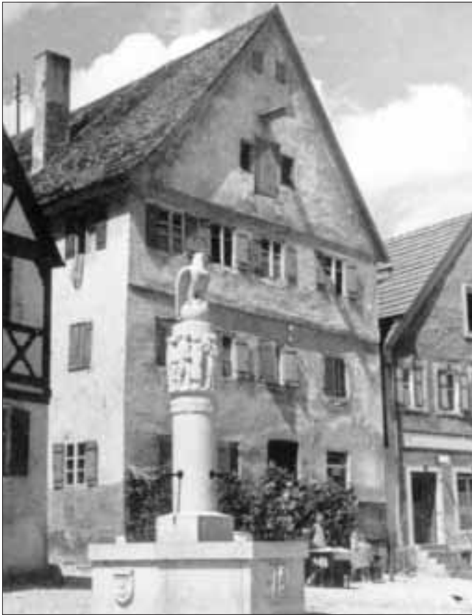
Stadtbrunnen, Marktplatz, um 1950