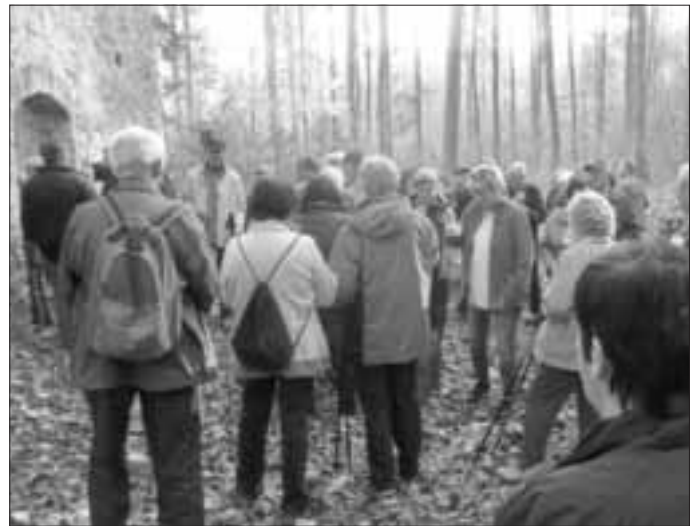
Die SoMit Wanderungen erfreuen sich reger Teilnahme.