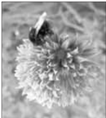
Hummel auf einer Schnittlauchblüte

„Biene Majas wilde Schwestern“ Bayrische Wildbienen ganz groß