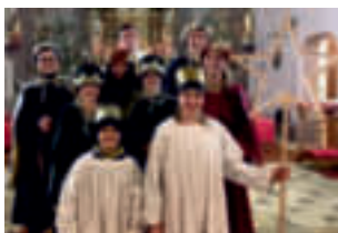
Wittesheim: 1053,- €