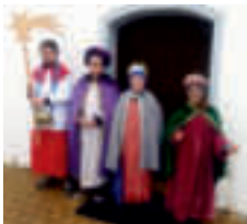
Kölbürg: 399,- €

Vielen Dank allen Sternsängern, den ehrenamtlichen Helferinnen und Helfern, den Begleiterinnen und Begleitern der Pizzeria Romana für die kostenlose Verpflegung und vor allem allen Spenderinnen und Spendern !!!!