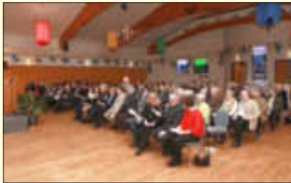
Gäste beim Neujahrsempfang 2019