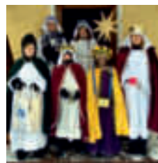
Rehau: 627,90 €