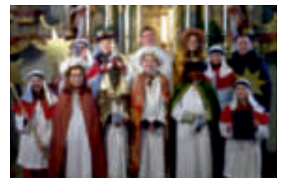
Flotzheim: 1362,65 €