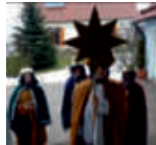
Warching: 480,- €