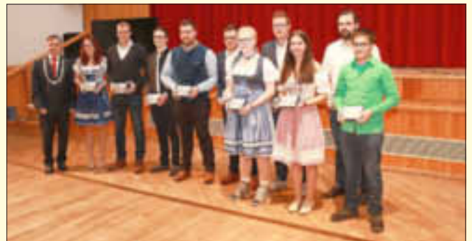
Schützengesellschaft 1858 Monheim e. V.