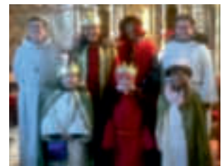
Weilheim: 603,70 €