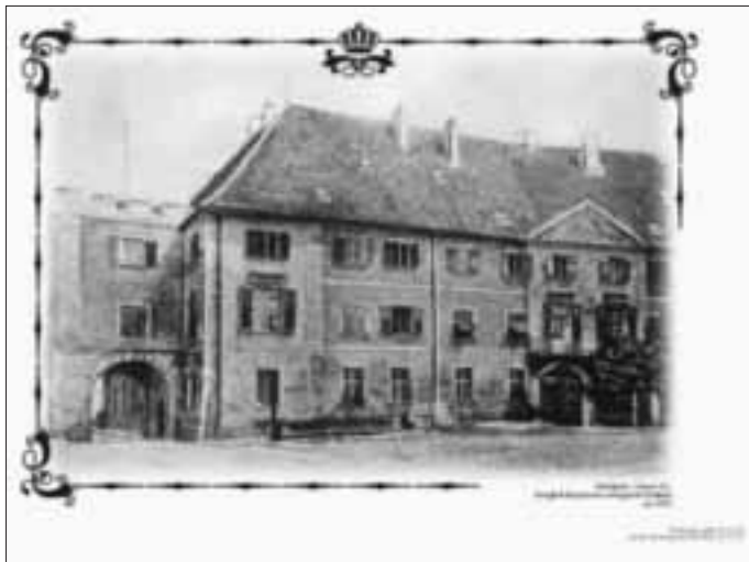
Königlich Bayerisches Amtsgericht (Schloss), Marktplatz, Unteres Tor, um 1903

(Archiv Stadtzeitung – Beitrag von Theo Schmiedt)