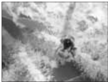
Maronenblüte mit Besucher

Dass wir ohne diese Pflanzenschutzmittel alle verhungern würden, ist eine gerne genutzte Aussage, die aber falsch ist. Wir wissen heute, dass auch mit Ökolandbau und robustem Saatgut hohe Erträge möglich sind. Nicht vergessen sollten wir auch, dass ein Großteil der Pestizide hierzulande genutzt wird, um Mais für Biogasanlagen zu produzieren.