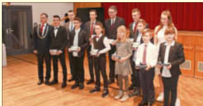
TSV Monheim 1895 e. V. - Karate