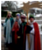
Ried: 120,- €