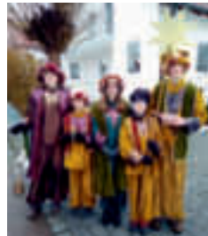
Itzing: 890,- €