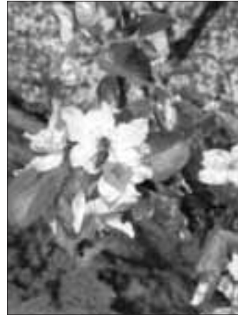
Foto: Honigbiene auf einer Apfelblüte

Selten haben wir als Bürger die Gelegenheit, unsere Heimat zum Positiven zu verändern. In der Zeit vom 31. Januar bis zum 13. Februar 2019 können wir es tun!