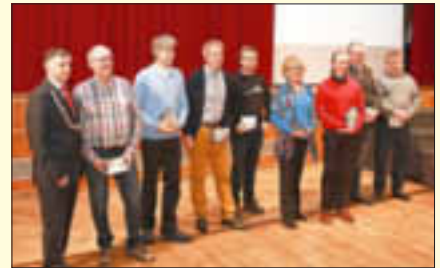
Ortsgruppe Monheimer Alb im Bund Naturschutz