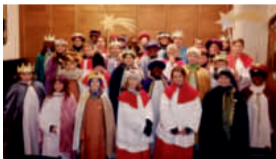
Monheim: 5540,73 €