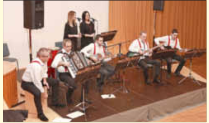
Sehr gute musikalische Umrahmung durch die musiMacherei