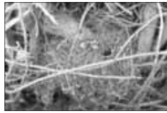
Waldhummelnest in einer Hecke

Wenn wir von Bienen hören, denken wir automatisch an die Honigbiene. Viele wissen gar nicht, dass wir in Deutschland 560 verschiedene Arten von Wildbienen hatten. Leider sind die ersten dieser faszinierenden Tiere ausgestorben, bevor wir auch nur die Zeit hatten, sie wirklich zu erforschen. Die Lage ist ernst, vielen Wildbienen fehlt es an Nahrung und passenden Nistmöglichkeiten.