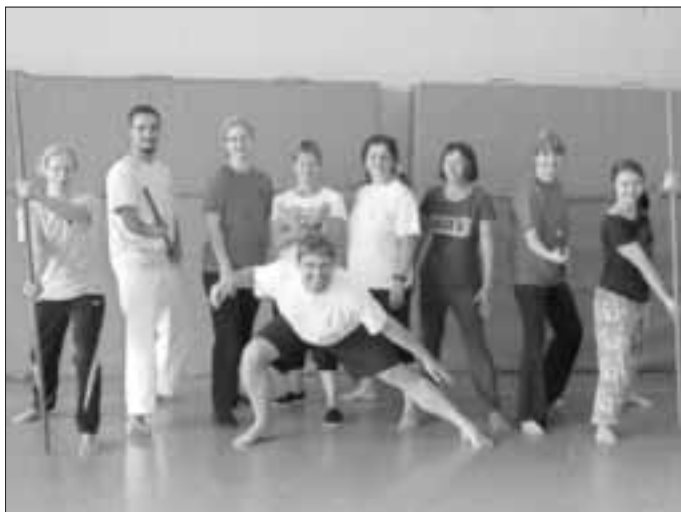
Bericht/Foto: Florian Huber

Feldenkraisübungen, sowie Meditationen rundeten das Programm ab, so dass es zusammen mit dem Grillabend bei Familie Neuwirth ein gelungenes Wochenende wurde.