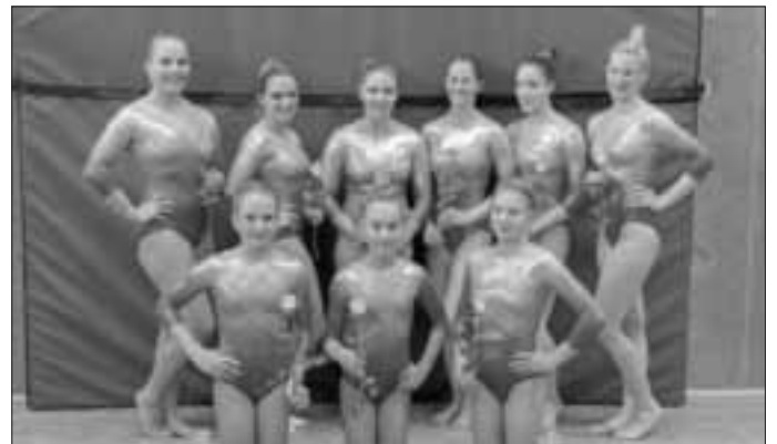
Haben sich in der Regionalliga gut etabliert: die Turnerinnen des TSV Monheim