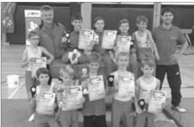
Haben allen Grund zur Freude: die Schüler D und E des TSV Monheim.