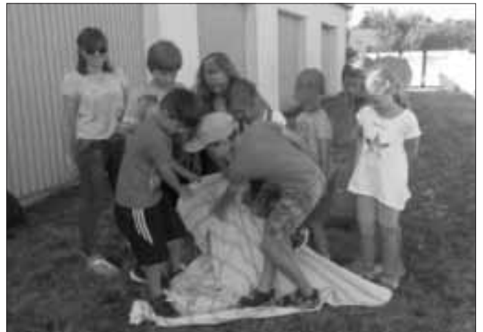
Bericht/Fotos: Julia Enhuber