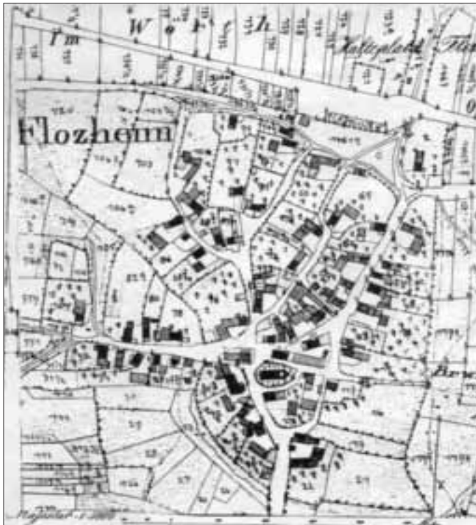
Karten-Ausschnitt Flotzheim