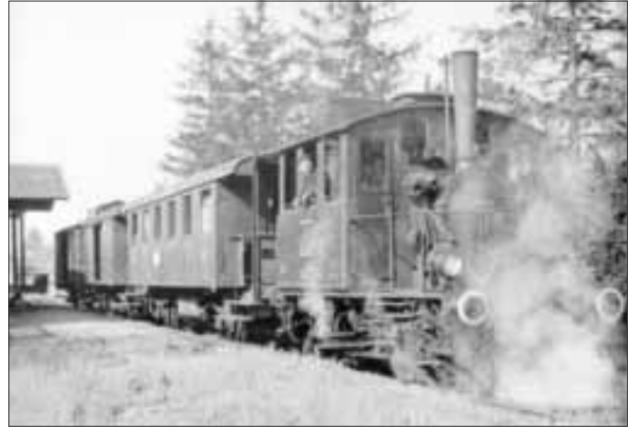
Die 98 314 ist mit ihrem Lokalbahnzug aus Fünfstetten kommend in Monheim (Schwab.) eingetroffen. Diese Aufnahme wurde bereits in der Sonderausgabe III/87 des Eisenbahn-Journals (Der "Glaskasten") abgedruckt. In der Bildlegende stand dort zu lesen, die Aufnahme könnte möglicherweise anlässlich der letzten Fahrt eines Glaskastens auf der Strecke Fünfstetten – Monheim (Schwab.) am 31.05.1957 entstanden sein. Aufgrund von Leserhinweisen liegt jedoch die Vermutung nahe, dass das Foto bereits in der ersten Jahreshälfte 1955 aufgenommen wurde.

1837 durchgeführt worden. Hierbei war bereits eine Trasse von Donauwörth nach Treuchtlingen festgelegt worden. Vorrang hatte aber die Magistrale von Hof über Nürnberg, Nördlingen, Donauwörth, Augsburg nach München, auf der im Jahre 1849 der Betrieb aufgenommen werden konnte.