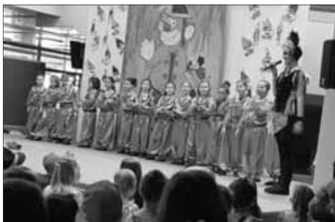
(Bilder / Bericht: Anja Koc)