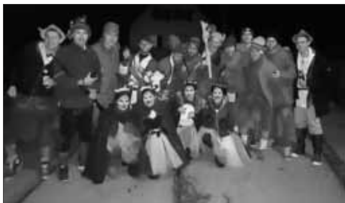
(Bericht und Bilder: Susanne Roßkopf)

Den Ausklang bildete der Kinderfasching am Sonntag. Ein kleiner Faschingszug marschierte bei Musik, Kinderpunsch und Jagertee durchs Dorf. Im Sportheim angekommen konnte der Abend nach dem Kinderprogramm noch gemütlich ausklingen. Unsere Geli versorgte uns mit gutem Essen und ausreichend flüssiger Nahrung.