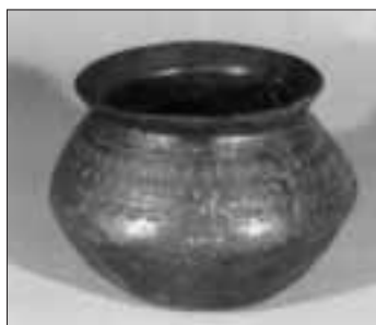
Qualitätsvoll gearbeitetes dunkles Tongefäß der Reihengräberzeit mit Stempelverzierung aus Weilheim.

Die sich in der ersten Hälfte des 6. Jahrhunderts abzeichnende Grenze zwischen dem alamannisch-schwäbischen Bereich und dem neugebildeten Stamm der Bajuwaren durchzieht das Monheimer Gebiet; das wiederum zunehmend unter fränkische Oberherrschaft gerät. Die Ursprünge der Stadt Monheim selbst gehen wohl auf eine im bajuwarischen Einflussbereich erfolgte Gründung des 6. oder 7. Jahrhunderts zurück, wie die noch heute bestehende Hauptsprachgrenze aufzeigt. In geschützter Tallage, in der Nähe eines Bachlaufes – also auf dem Gebiet der heutigen Altstadt – dürfte die erste Ansiedlung entstanden sein. Die Lage an der einstigen, fest ausgebauten römischen Fernstraße, die ursprünglich die Provinzhauptstadt Rätien – also Augsburg – mit der Grenzgarison Weißenburg verband, hat sicherlich die Entwicklung des Ortes und auch des Klosters günstig beeinflusst. Der zur frühen Siedlung gehörende Reihengräberfriedhof der Gründungszeit könnte durchaus auf der Anhöhe – nordöstlich der Stadt – zu suchen sein, bei dem dann im frühen 8. Jahrhundert eine Peterskirche errichtet worden ist. Von dieser Zeit an, mit der Nennung Monheims in der »Vita S. Walburgae« (750 – 780), stehen der Ortsgeschichte erstmals schriftliche Urkunden zur Verfügung.