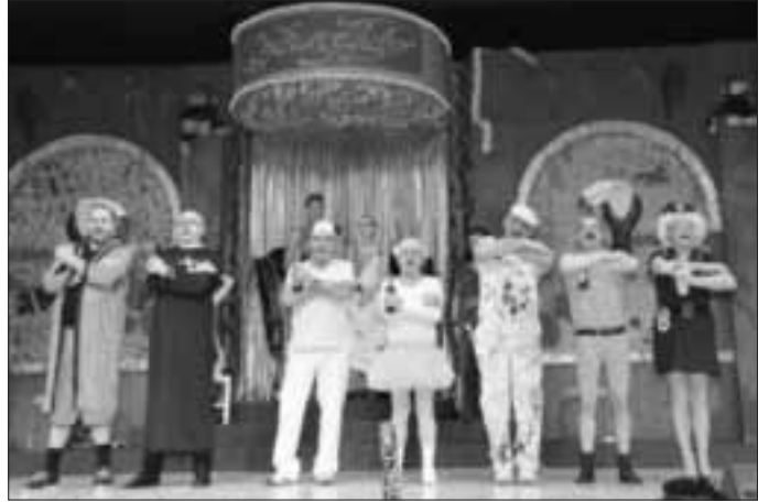
Die neuen Alten

Ein weiteres Highlight der Veranstaltung waren die „Neuen Alten“, die als Politesse, Turner, Pfarrer, Ballerina, Maler, Bäcker und Boxer die Bühne und den Saal eroberten.