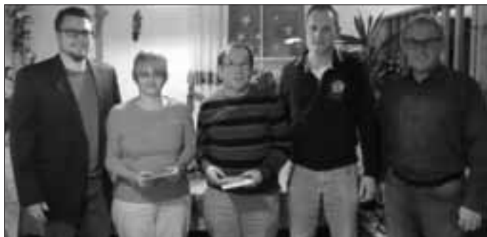
(Bericht: Norbert Meyer)