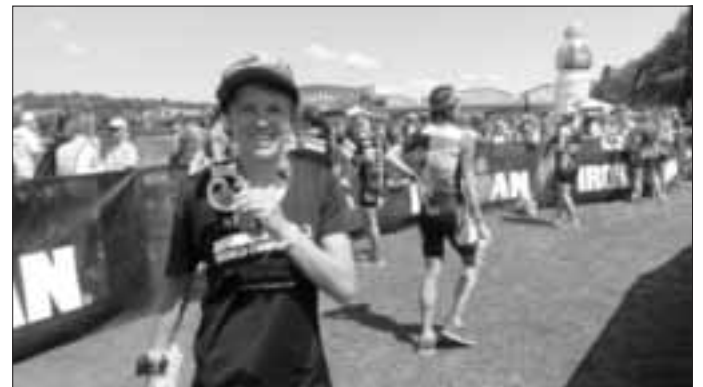
Im Ziel bei der Ironman 70.3 WM in Chattanooga

Beim Schwimmstart auf die 1,9km lange Strecke im Tennessee River musste die erste Hälfte gegen die Strömung, und die zweite Hälfte mit der Strömung geschwommen werden. Dies war ein schwindelerregendes Gefühl im River und noch dazu mit 24° Grad Wassertemperatur und Neo. Das ist in Deutschland nicht vorstellbar, denn man überhitzt fast im Wasser. Nach 35:45min stieg sie aus dem Wasser und wechselte auf die 90km Radstrecke, die ungewöhnlich harte Anstiege hatte, und verlor nach 60km auch noch ihre Trinkflasche, was bei den heißen Temperaturen fatal war. Nach 2:48h auf dem Bike ging es nun auf die Halbmarathonstrecke wo sich die 30° Grad Lufttemperatur besonders bemerkbar machte. Noch dazu sechs giftige Anstiege über Brücken und Hügel. Für den Halbmarathon benötigte sie noch 1:38 was zu einer Gesamtzeit von 5:07:47 im Ziel bedeutete. In ihrer Altersklasse W25-29 Jahre kam sie mit dieser Zeit auf den 28.Rang von 162 Frauen. Ebenfalls war sie in dieser AK schnellste Deutsche Starterin.