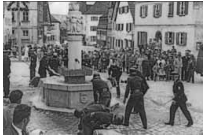
Feuerwehrrübung im Mai 1963, Archiv: R. Hanke / Dr. Reng

Deshalb wurde das Becken des Stadtbrunnens mit vollem Rohr geflutet. Dabei entstand ein so großer Wasserdrall, dass die Beckenwandungen auseinanderbrachen. Vielen Schaulustigen ist das Ereignis noch in Erinnerung und es ist auch auf Fotos gut dokumentiert.