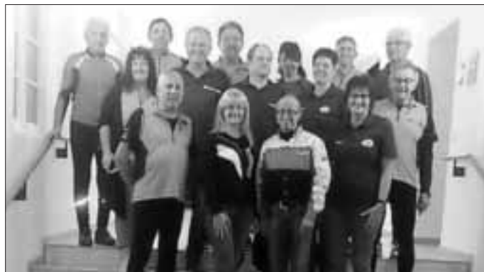
Foto nach Spendenübergabe von Bike & Motorwelt im Haus der Kultur/Kreuzwirt

Auch den Firmeninhabern hat unsere Idee des „Radl-Nachmittags“ mit Weihe und Ausstellung sehr gut gefallen. Sie begrüßen allgemein die vielen, verschiedensten Aktivitäten der Vereine in Monheim und unterstützen uns z.B. bereits seit etlichen Jahren im Rahmen der traditionellen Theateraufführungen - hierfür auch nochmals besten Dank.