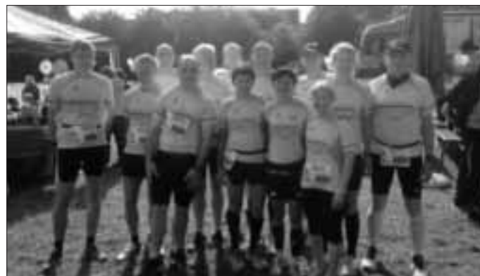
LäuferInnen der LG Warching vor dem Start

Der Halbmarathon mit rund 900 Finishern startete um elf Uhr bei fast idealen Laufbedingungen.