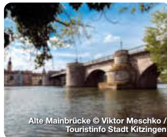
Alte Mainbrücke