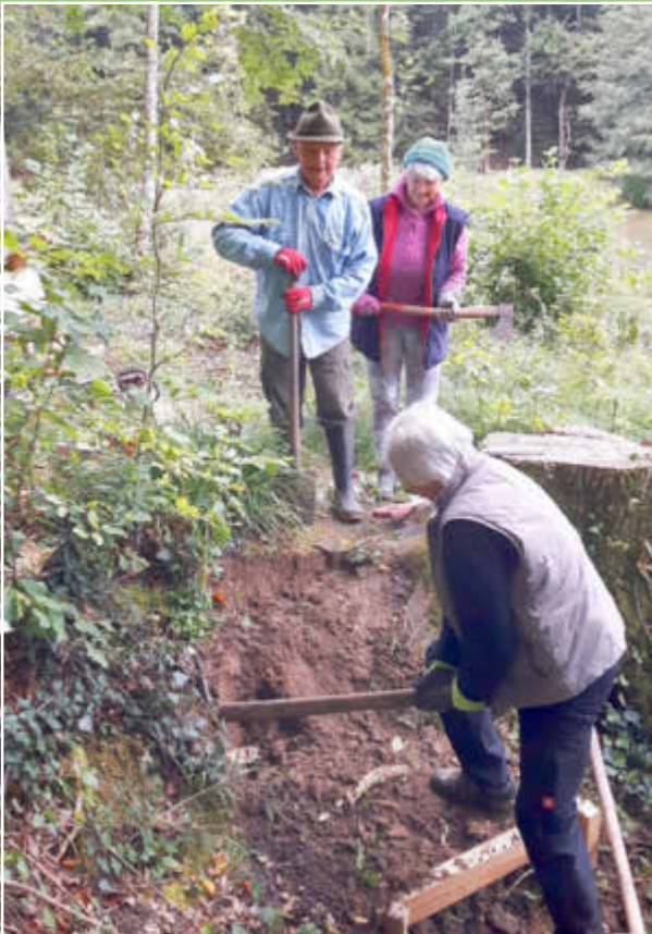
Während der Arbeit