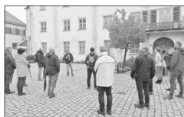
Monheimer Whisky-Tour - Whisky-Tasting mit Stadtführung

Kosten: 40,00 € / Person inkl. Stadtführung, Whisky, Whisky-Glas, Weißbrot, Haggis, Wasser und Musik