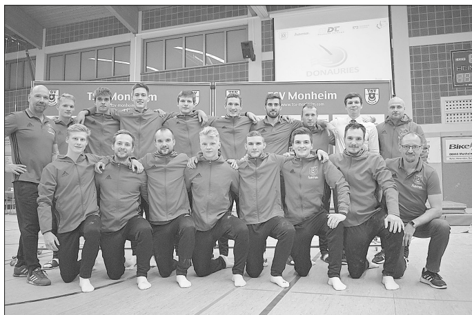
Mannschaftsbild Turner TSV Monheim