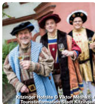
Kitzinger Hofräte