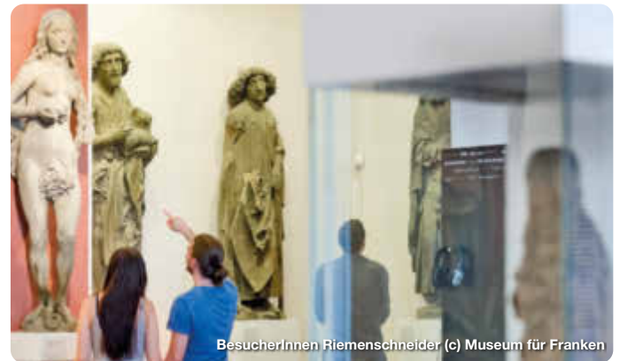
BesucherInnen Riemenschneider