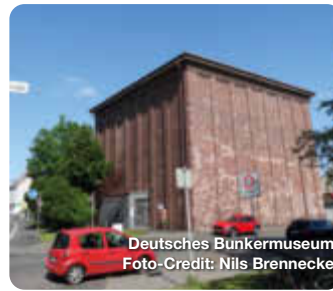
Deutsches Bunkermuseum