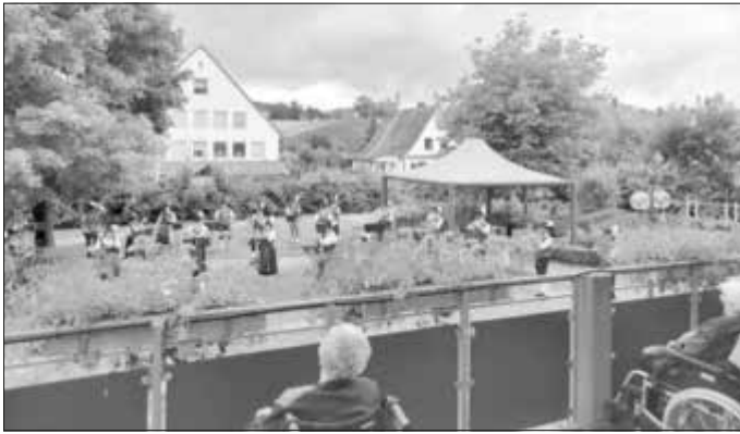
Die Bewohner auf Ihren Balkonen lauschten den Klängen der Stadtkapelle Monheim