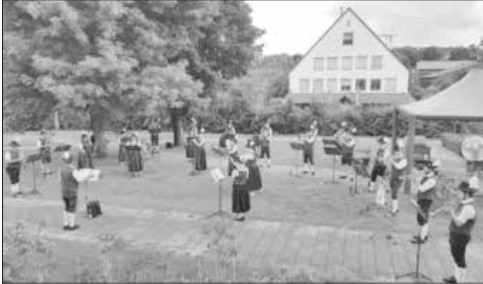
Standkonzert für die Bewohner*Innen vor dem Seniorenheim Monheim