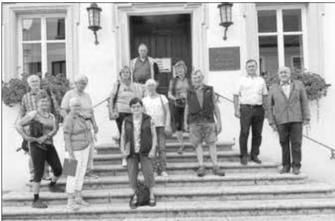
Die „Kulturradler“ des Verein f. Ambulante Krankenpflege Wemding bei Ihrem Besuch in der „Drei-Stämme-Stadt“