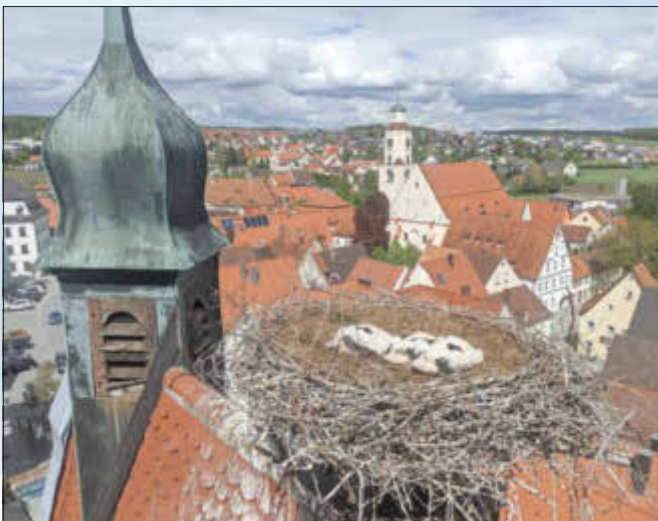
Die drei Jungstörche im Nest am Oberen Torturm