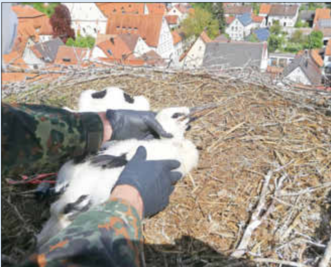
Die Jungstörche haben bereits eine stattliche Größe