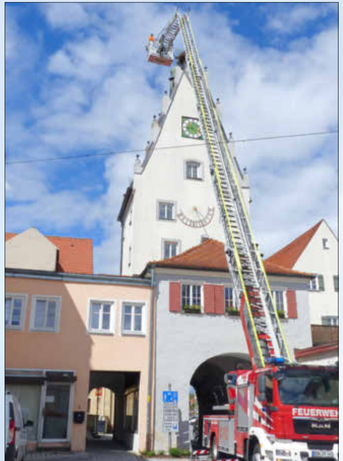
Mit der Drehleiter ganz nach oben