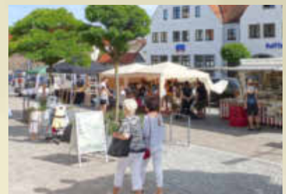
Markttreiben auf dem erweiterten Marktgelände in der Neuburger Straße