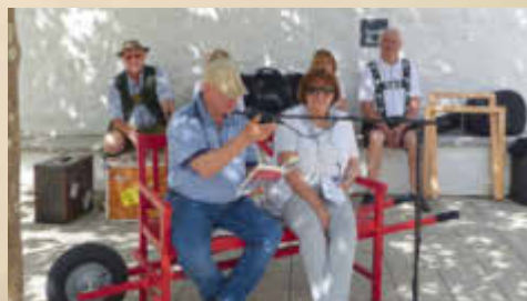
Der Autorenclub Donau-Ries mit der „Roten Bank“ im KULTURHOF