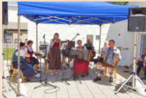
Die Hirtenbuckmusikanten spielten im KULTURHOF auf