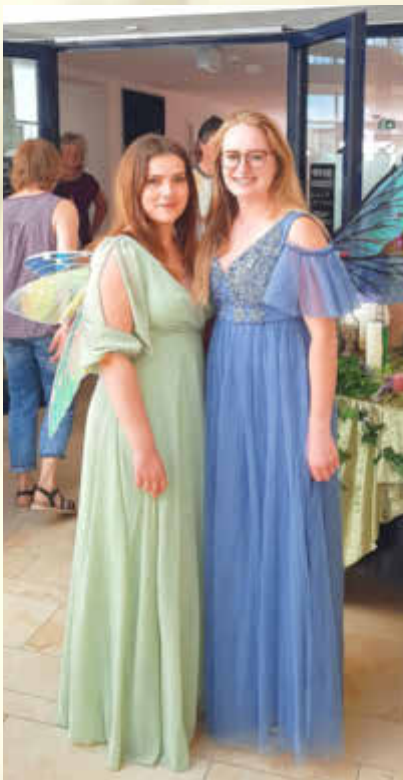
Zauberhafte Feen bei der Fantasy-Foto-Ausstellung im Kreuzwirt