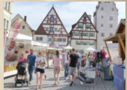
Bestes Sommerwetter lockte zahlreiche Besucher auf den Monheimer KunstHandWerkMarkt