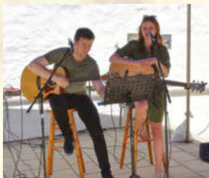
Das Duo Pluspunkt im KULTURHOF mit Live-Musik