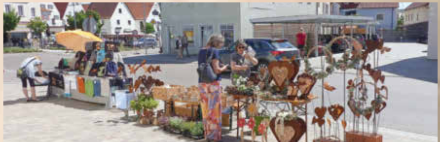
Auch in der Donauwörther Straße fanden zahlreiche Fieranten ihren Platz

(Text: StadtAktivManagement)