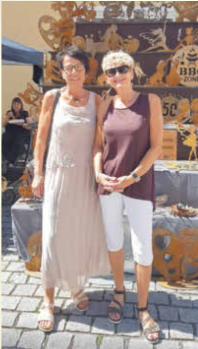
Fröhliche Besucherinnen beim Kunst-HandWerkMarkt