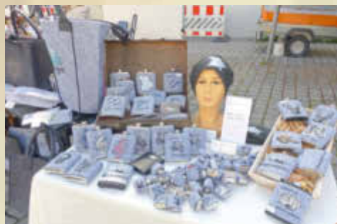
Nettes aus Filz