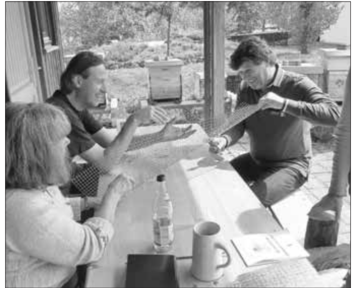
(Text und Fotos: Renate Röding)