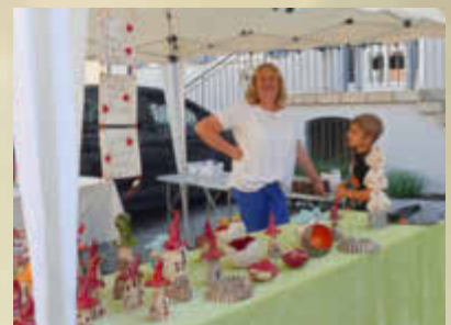
Getöpferte Ware in der Innenstadt