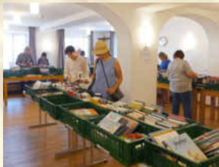
Großen Anklang fand der Bücherflohmarkt im Kreuzwirt Mehrzweckraum