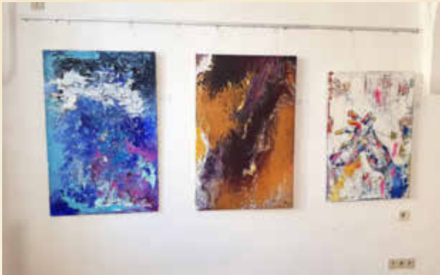
Ausgestellte Kunstwerke von der Malerin Adina Steiner im Haus des Gastes