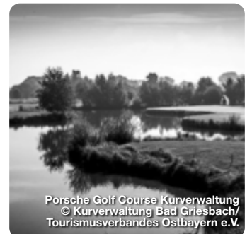
Porsche Golf Course Kurverwaltung

Mit 37 Pros, dem Golfodrom und der Golfakademie, die mit einem weltweit einzigartigen, patentierten Golflehresystem unterrichtet, ist Bad Griesbach das größte zusammenhängende Golf-Resort Europas. Vom 11. bis 15. Juli 2022 findet die Rottaler Bäderdreieck Golfwoche statt. Das Turnier wird über 18 Löcher ausgetragen, und zwar auf Bad Griesbacher Seite sowohl über den Porsche Golf Course, als auch über den Platz des Golfclubs Sagmühle, den Bella Vista Golfpark in Bad Birnbach und den Thermengolfplatz Bad Füssing in Kirchham.