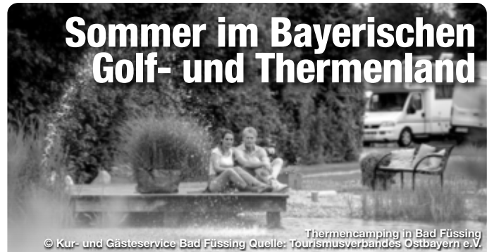
Thermencamping in Bad Füssing

Sommer in den Thermen des Bayerischen Golf- und Thermenlandes heißt neben dem Thermalbaden auch ganz viel draußen in der Natur sein. Die fünf Heil- und Thermalbäder der niederbayerischen Gesundheitsregion zwischen Passau, Regensburg und Landshut liegen eingebettet in wunderschöne Kulturlandschaften, die sich gerade im Sommer in Verbindung mit gesunder Bewegung aufs Schönste erkunden und genießen lassen.