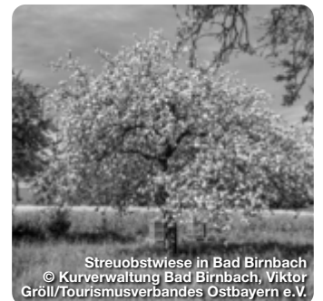
Streuobstwiese in Bad Birnbach

Streuobstwiesen sind ökologisch wertvoll: Vielen Tierarten bieten sie wichtige Lebensräume. Dem Menschen schenken sie duftende Blütenpracht und süße Früchte. In Bad Birnbach, dem ländlichen Bad im Bayerischen Golf- und Thermenland, werden die Rottaler Streuobstwiesen als Naturschatz gepflegt und für Urlaubsgäste erlebbar gemacht.