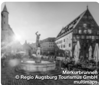
Merkurbrunnen © Regio Augsburg Tourismus GmbH multimap