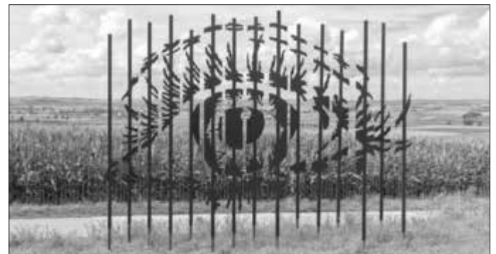
Das Kunstwerk „Blick ins Ries“ von Wolfgang Balzer war eines der Highlights des Kunstpfades 2019